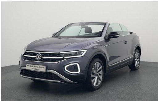
Volkswagen Zentrum Leverkusen