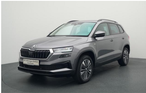
Volkswagen Zentrum Leverkusen