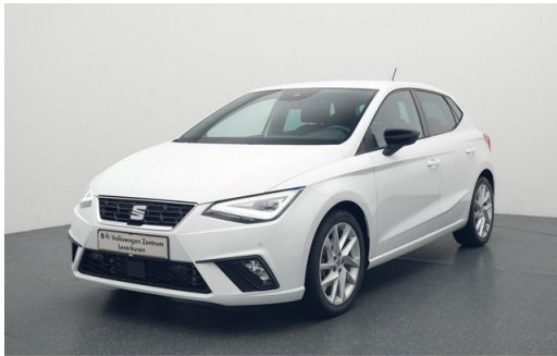
Volkswagen Zentrum Leverkusen