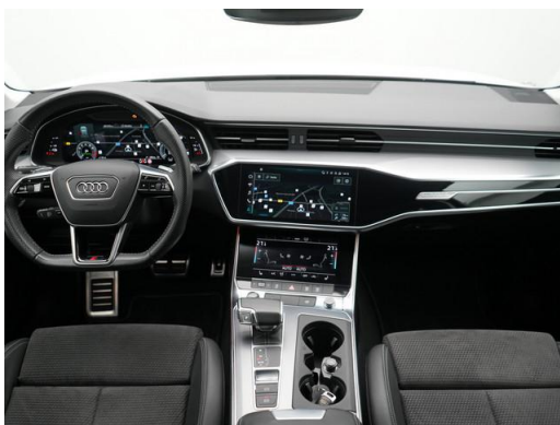
Bild dient zur Visualisierung - Abbildung zeigt Sonderausstattung gegen Mehrpreis.