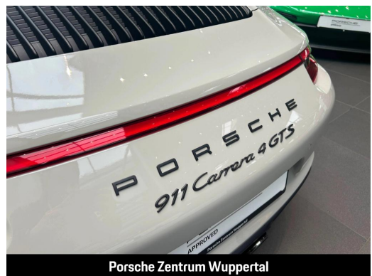
Porsche Zentrum Wuppertal