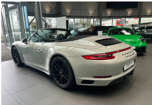
Porsche Zentrum Wuppertal