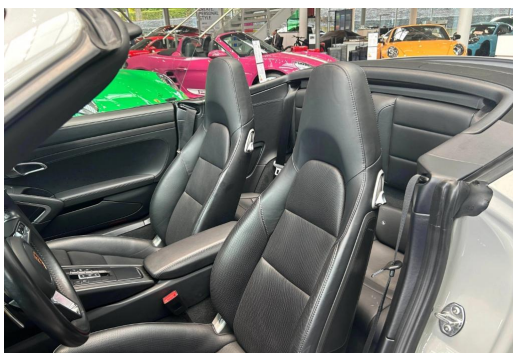
Porsche Zentrum Wuppertal