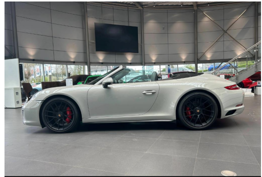
Porsche Zentrum Wuppertal