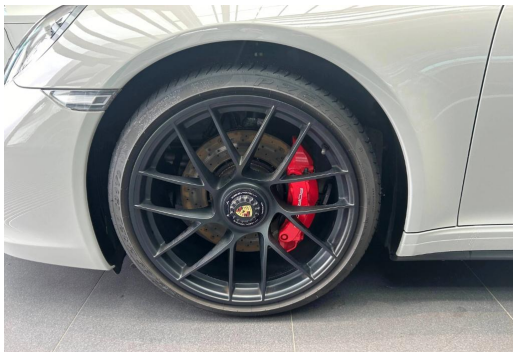
Porsche Zentrum Wuppertal