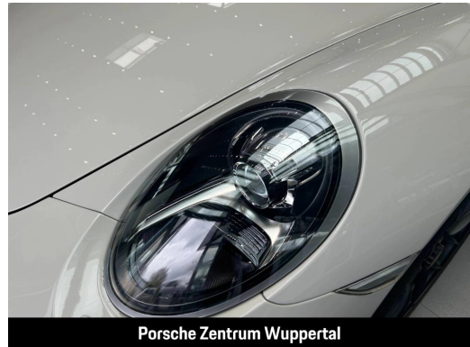
Porsche Zentrum Wuppertal