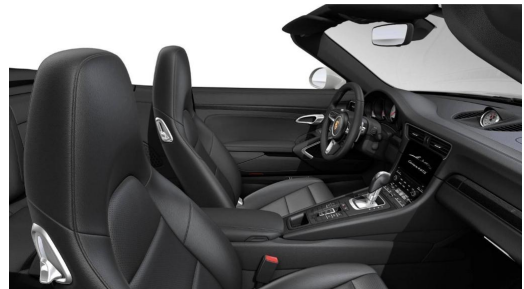
Porsche Zentrum Wuppertal