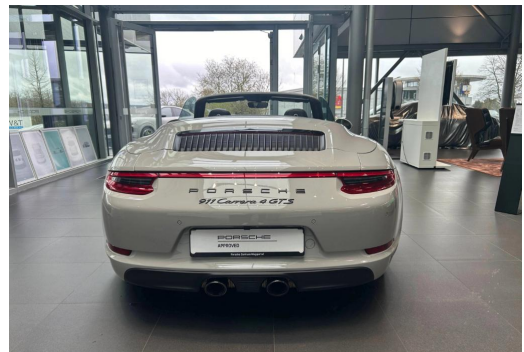
Porsche Zentrum Wuppertal