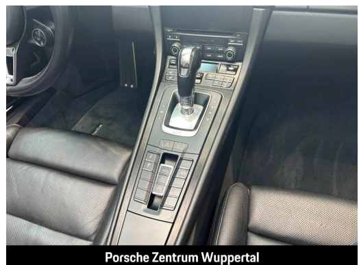
Porsche Zentrum Wuppertal