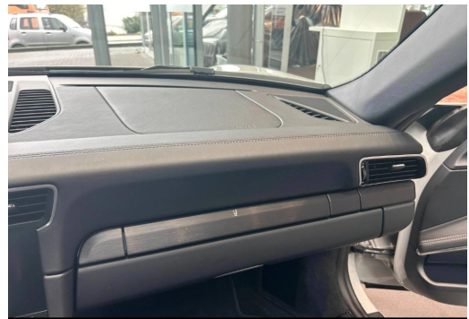
Porsche Zentrum Wuppertal