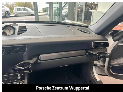
Porsche Zentrum Wuppertal