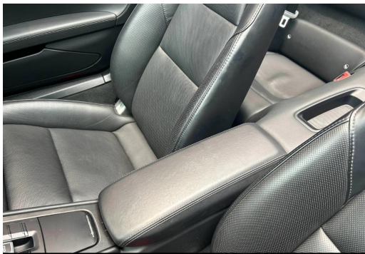
Porsche Zentrum Wuppertal