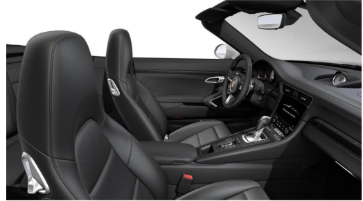
Porsche Zentrum Wuppertal