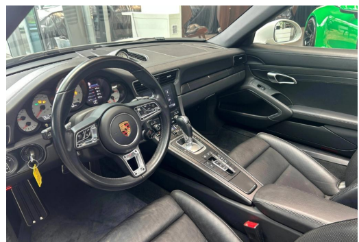
Porsche Zentrum Wuppertal