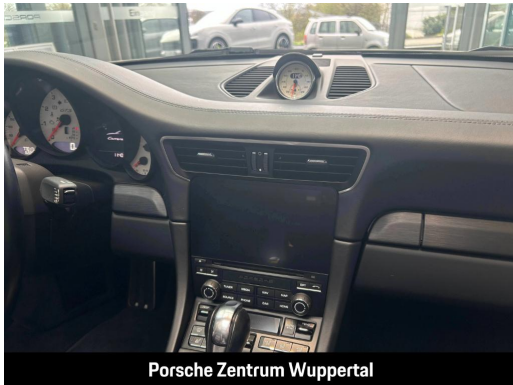
Porsche Zentrum Wuppertal