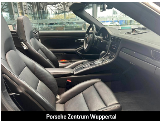
Porsche Zentrum Wuppertal