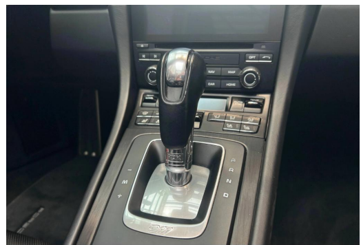
Porsche Zentrum Wuppertal