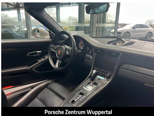
Porsche Zentrum Wuppertal