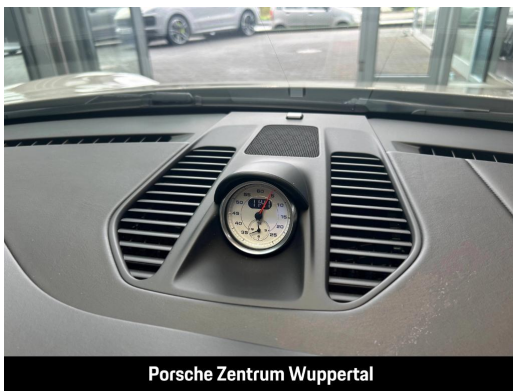
Porsche Zentrum Wuppertal