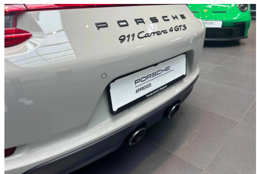
Porsche Zentrum Wuppertal