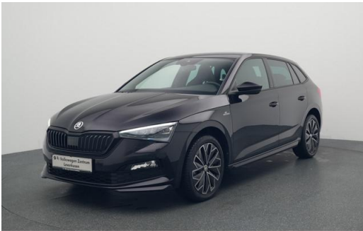
Volkswagen Zentrum Leverkusen