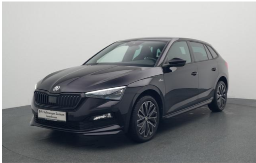
Volkswagen Zentrum Leverkusen