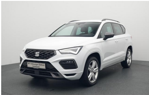
Volkswagen Zentrum Leverkusen