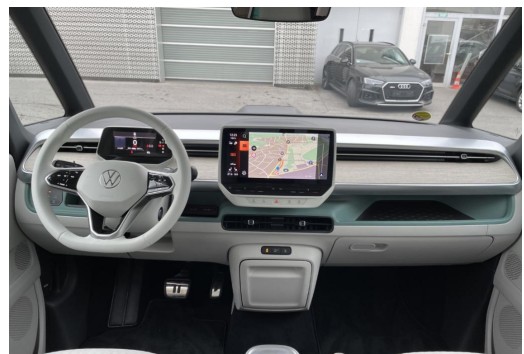
Mülheim GOTTFRIED SCHULTZ