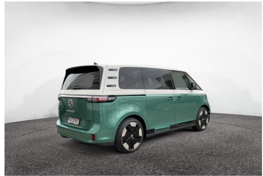
Mülheim GOTTFRIED SCHULTZ