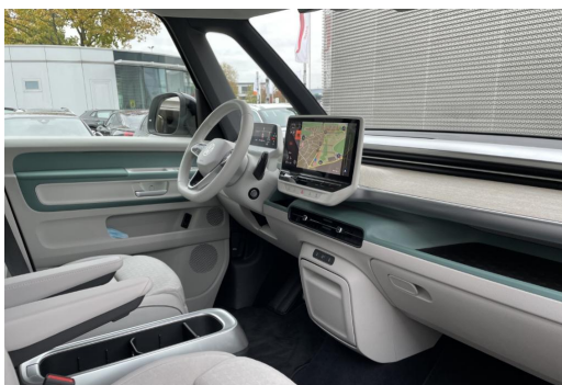
Mülheim GOTTFRIED SCHULTZ