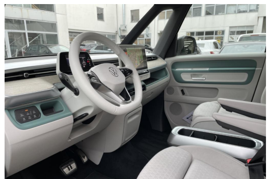
Mülheim GOTTFRIED SCHULTZ