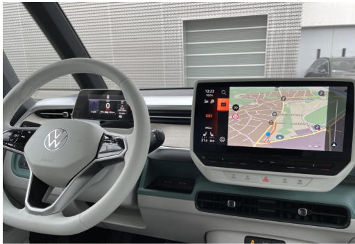
Mülheim GOTTFRIED SCHULTZ