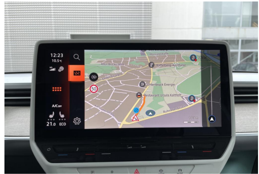
Mülheim GOTTFRIED SCHULTZ