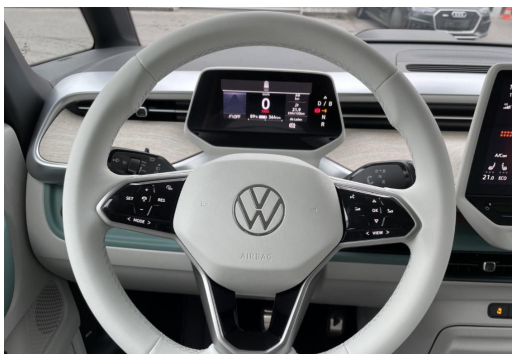
Mülheim GOTTFRIED SCHULTZ