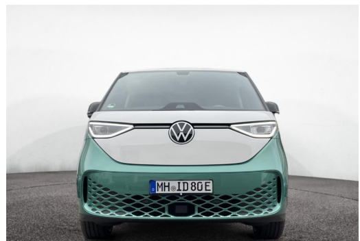
Mülheim GOTTFRIED SCHULTZ