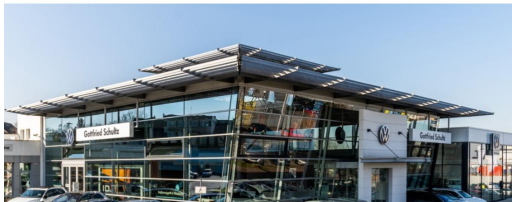
Mülheim GOTTFRIED SCHULTZ