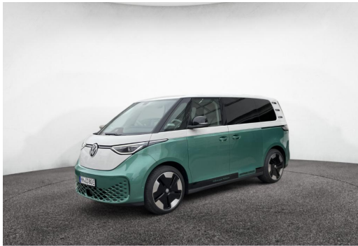
Mülheim GOTTFRIED SCHULTZ