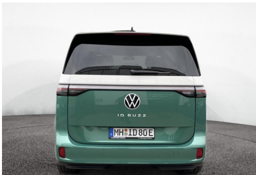
Mülheim GOTTFRIED SCHULTZ