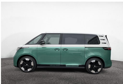
Mülheim GOTTFRIED SCHULTZ