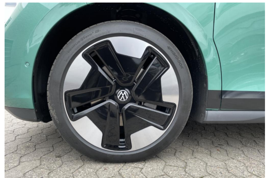
Mülheim GOTTFRIED SCHULTZ