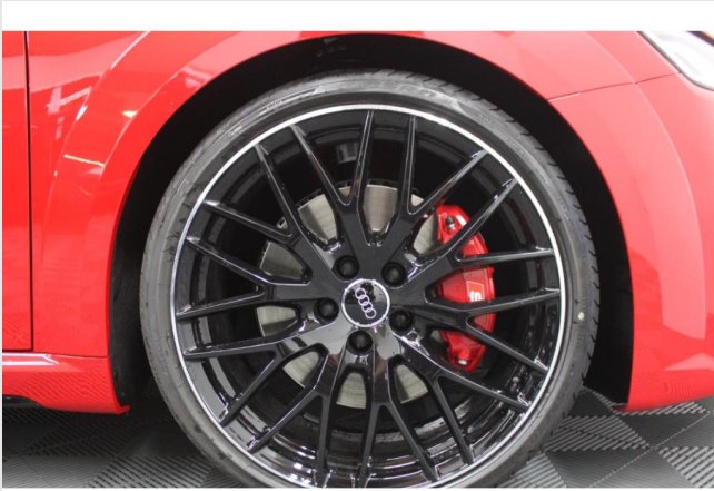
Hagen GOTTFRIED SCHULTZ

Angebotsnummer: 26414 Ausdruck vom: 28.04.2024