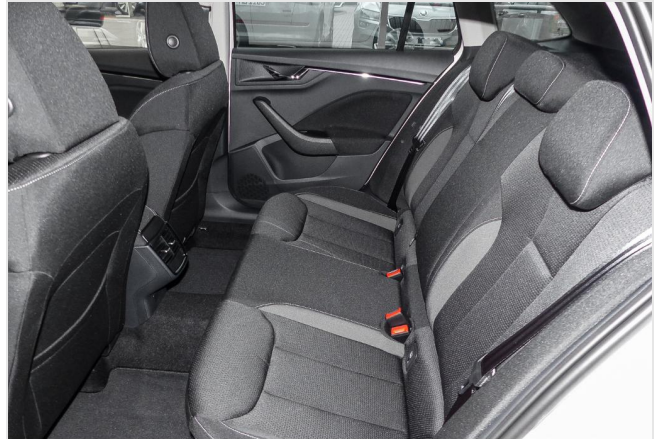
Škoda Centrum Düsseldorf GOTTFRIED SCHULTZ