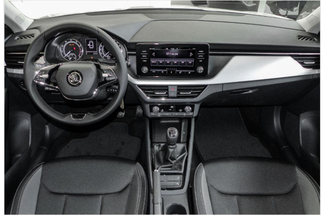
Škoda Centrum Düsseldorf GOTTFRIED SCHULTZ