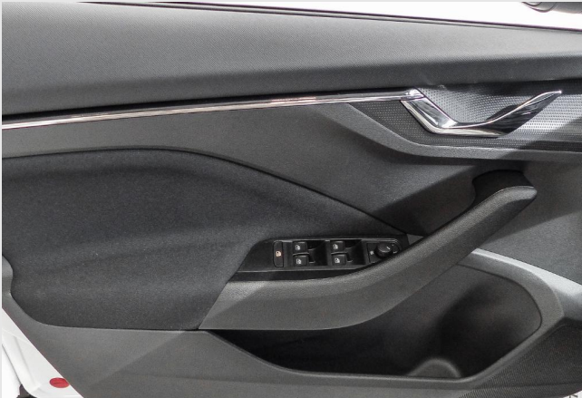
Škoda Centrum Düsseldorf GOTTFRIED SCHULTZ

Angebotsnummer: 35074 Ausdruck vom: 29.04.2024