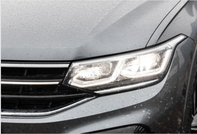
Grevenbroich GOTTFRIED SCHULTZ

Angebotsnummer: 99488 Ausdruck vom: 28.04.2024