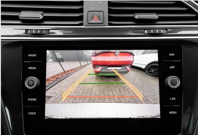
Grevenbroich GOTTFRIED SCHULTZ

Angebotsnummer: 99488 Ausdruck vom: 28.04.2024