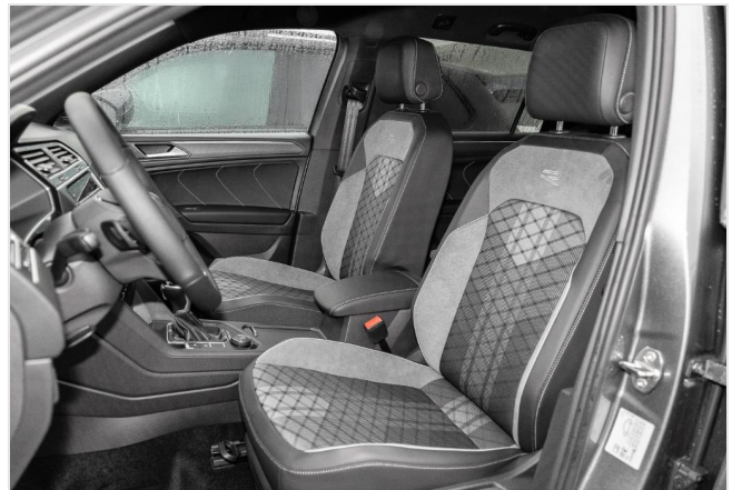
Grevenbroich GOTTFRIED SCHULTZ