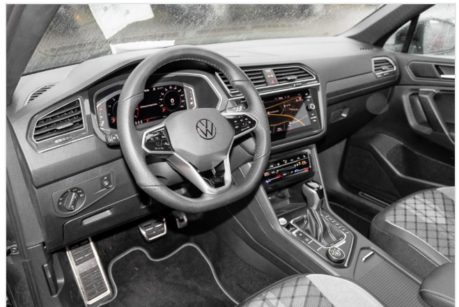
Grevenbroich GOTTFRIED SCHULTZ