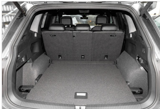
Grevenbroich GOTTFRIED SCHULTZ