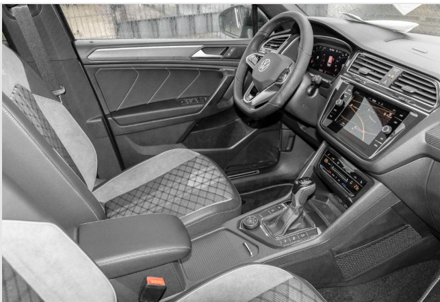
Grevenbroich GOTTFRIED SCHULTZ