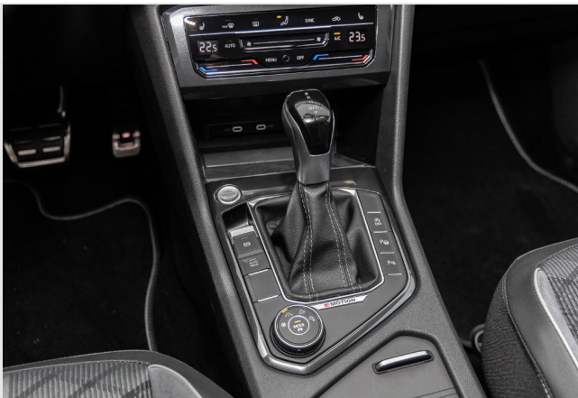
Grevenbroich GOTTFRIED SCHULTZ