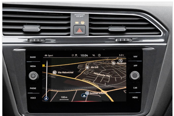
Grevenbroich GOTTFRIED SCHULTZ