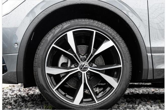
Grevenbroich GOTTFRIED SCHULTZ