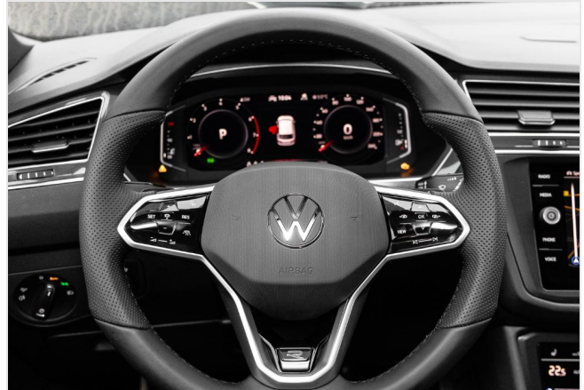
Grevenbroich GOTTFRIED SCHULTZ