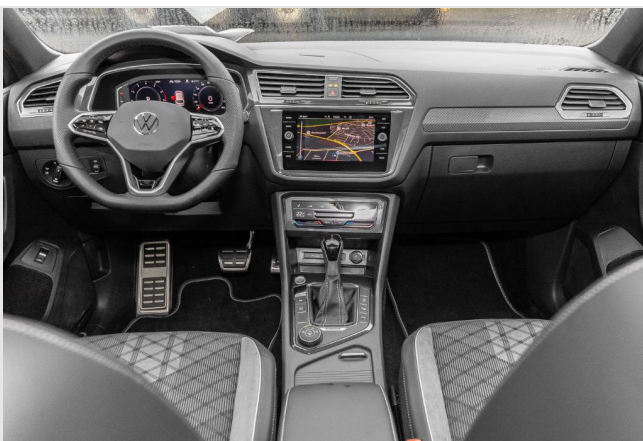
Grevenbroich GOTTFRIED SCHULTZ