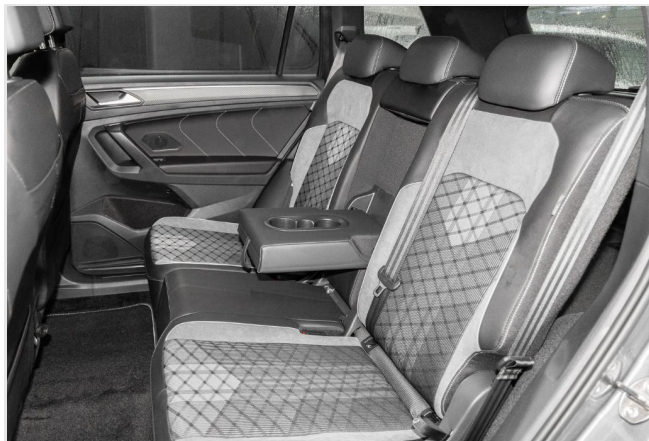
Grevenbroich GOTTFRIED SCHULTZ

Angebotsnummer: 99488 Ausdruck vom: 28.04.2024