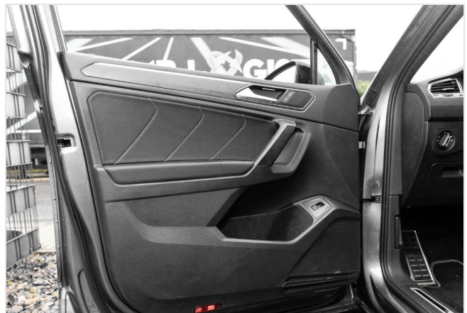
Grevenbroich GOTTFRIED SCHULTZ