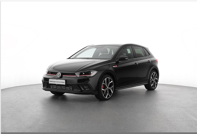
Volkswagen Zentrum Essen GOTTFRIED SCHULTZ