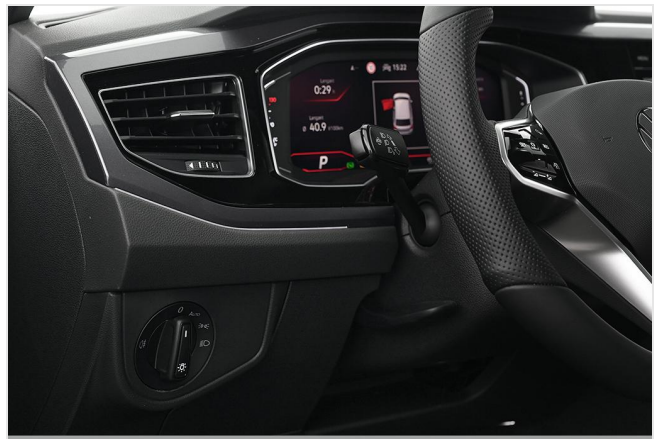
Volkswagen Zentrum Essen GOTTFRIED SCHULTZ