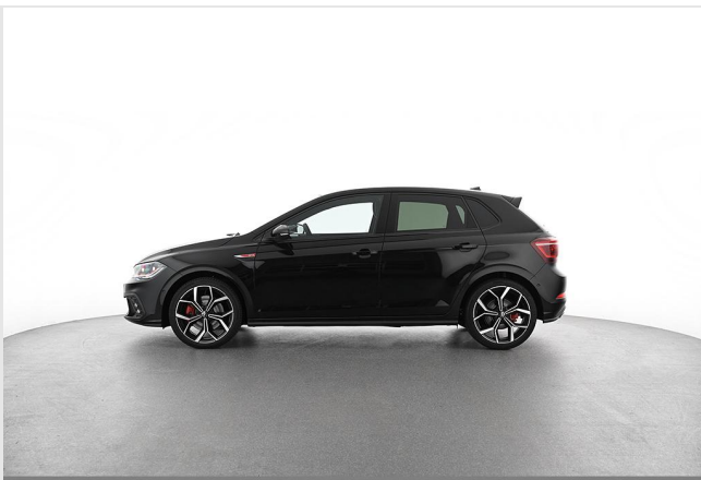
Volkswagen Zentrum Essen GOTTFRIED SCHULTZ