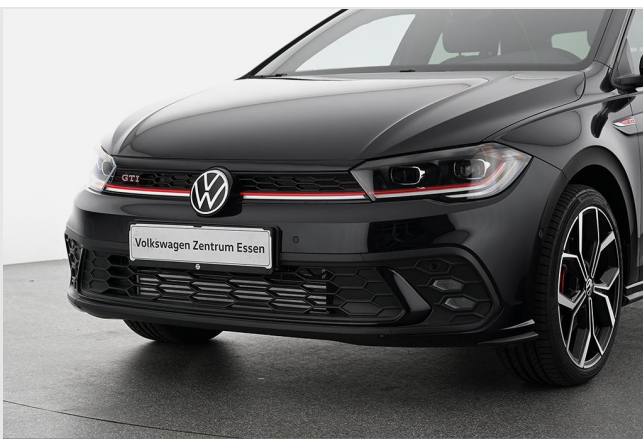
Volkswagen Zentrum Essen GOTTFRIED SCHULTZ