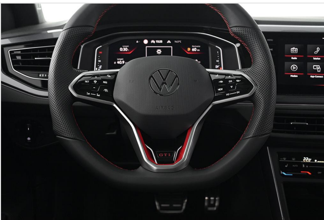
Volkswagen Zentrum Essen GOTTFRIED SCHULTZ