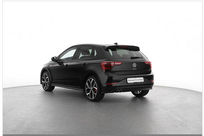
Volkswagen Zentrum Essen GOTTFRIED SCHULTZ