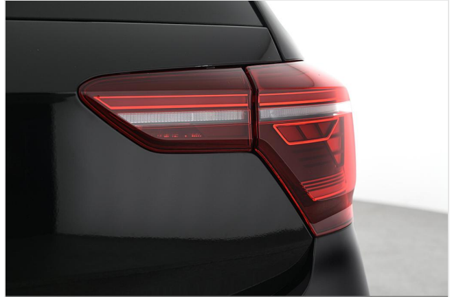
Volkswagen Zentrum Essen GOTTFRIED SCHULTZ