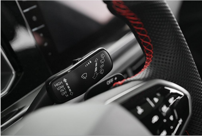
Volkswagen Zentrum Essen GOTTFRIED SCHULTZ

Angebotsnummer: 70949 Ausdruck vom: 29.04.2024