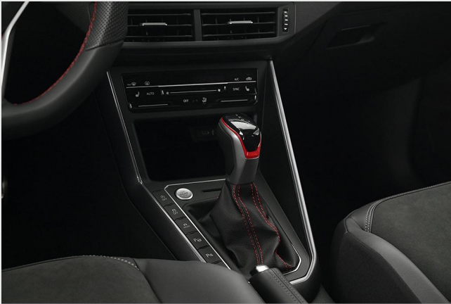
Volkswagen Zentrum Essen GOTTFRIED SCHULTZ

Angebotsnummer: 70949 Ausdruck vom: 29.04.2024