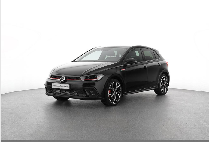
Volkswagen Zentrum Essen GOTTFRIED SCHULTZ