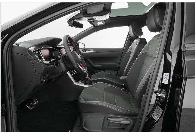
Volkswagen Zentrum Essen GOTTFRIED SCHULTZ