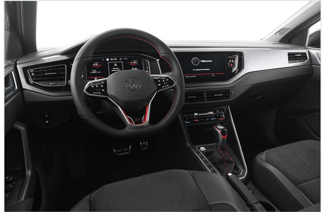
Volkswagen Zentrum Essen GOTTFRIED SCHULTZ