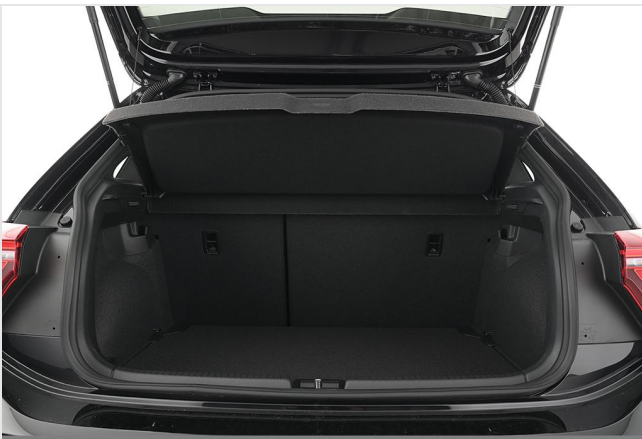
Volkswagen Zentrum Essen GOTTFRIED SCHULTZ