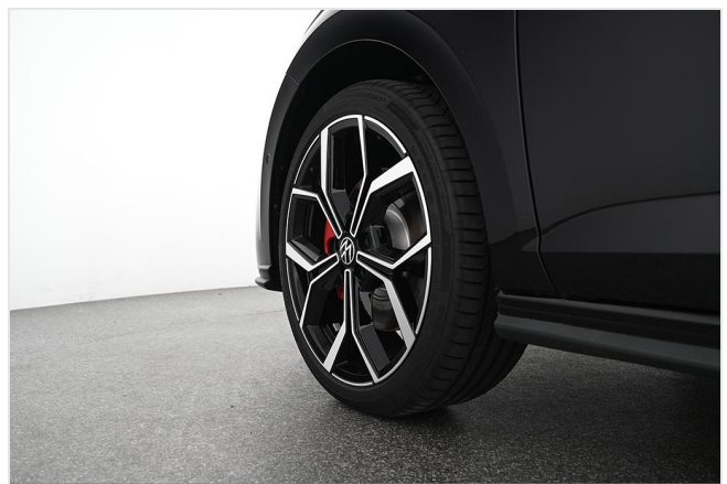
Volkswagen Zentrum Essen GOTTFRIED SCHULTZ