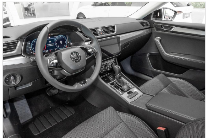
Dormagen GOTTFRIED SCHULTZ