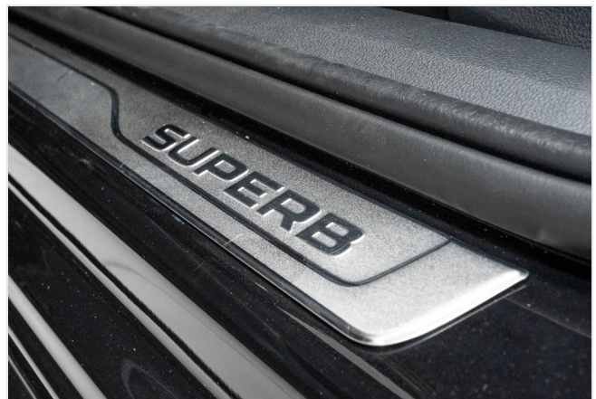
Dormagen GOTTFRIED SCHULTZ