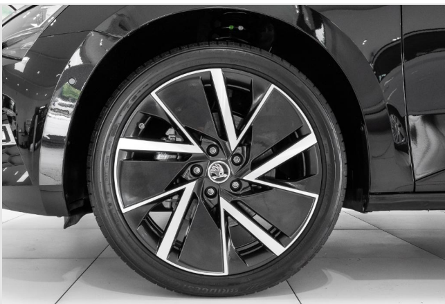
Dormagen GOTTFRIED SCHULTZ