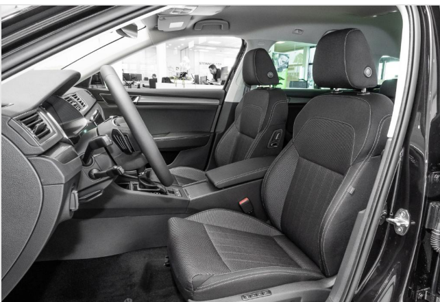
Dormagen GOTTFRIED SCHULTZ