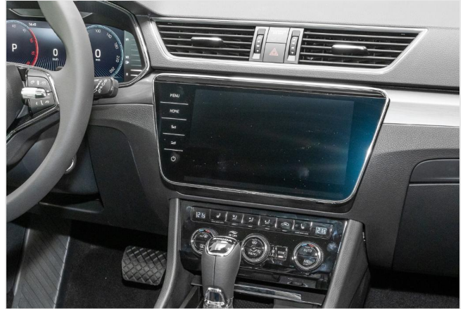
Dormagen GOTTFRIED SCHULTZ