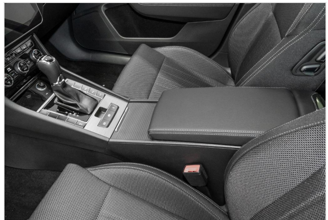
Dormagen GOTTFRIED SCHULTZ