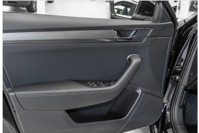
Dormagen GOTTFRIED SCHULTZ