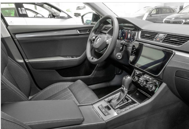
Dormagen GOTTFRIED SCHULTZ