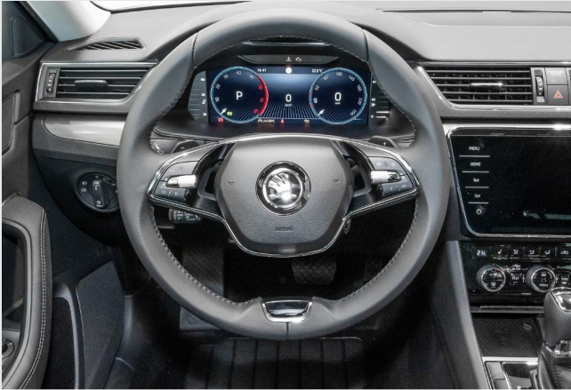
Dormagen GOTTFRIED SCHULTZ

Angebotsnummer: 10431 Ausdruck vom: 28.04.2024