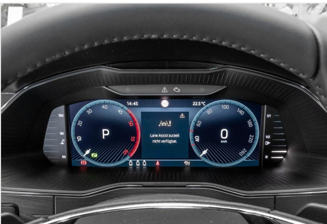
Dormagen GOTTFRIED SCHULTZ