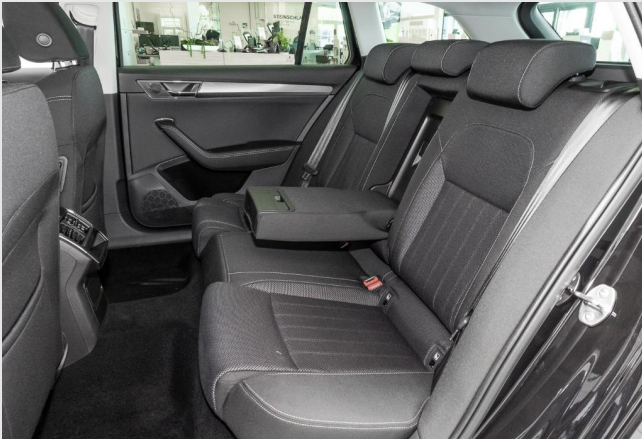
Dormagen GOTTFRIED SCHULTZ

Angebotsnummer: 10431 Ausdruck vom: 28.04.2024