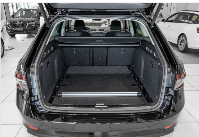
Dormagen GOTTFRIED SCHULTZ