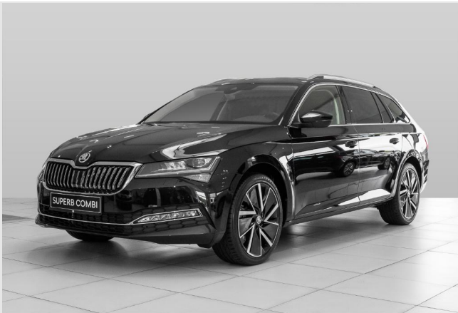
Dormagen GOTTFRIED SCHULTZ