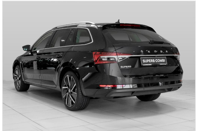
Dormagen GOTTFRIED SCHULTZ