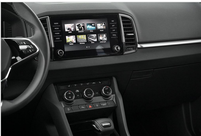
Škoda Zentrum Essen GOTTFRIED SCHULTZ