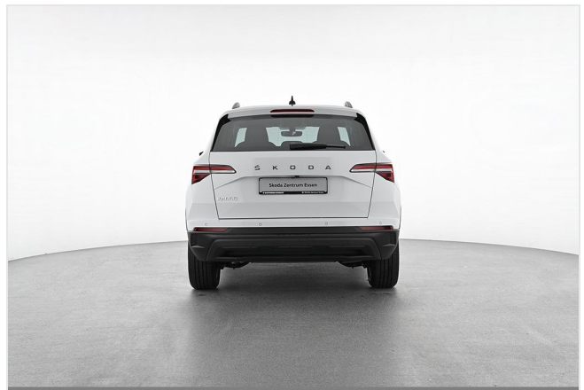
Škoda Zentrum Essen GOTTFRIED SCHULTZ