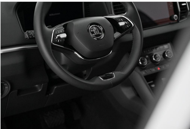
Škoda Zentrum Essen GOTTFRIED SCHULTZ