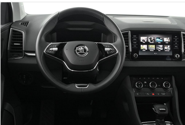
Škoda Zentrum Essen GOTTFRIED SCHULTZ