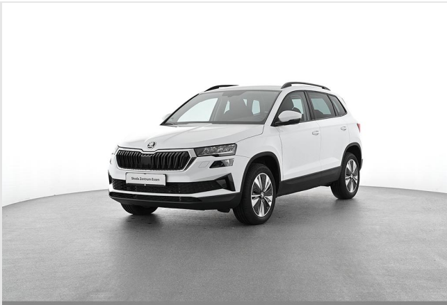
Škoda Zentrum Essen GOTTFRIED SCHULTZ