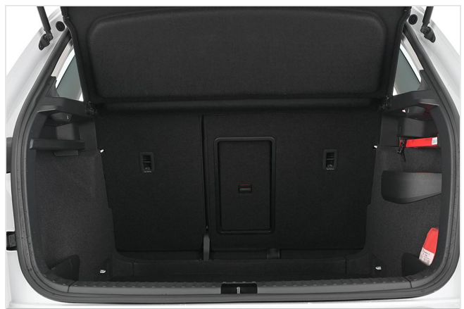
Škoda Zentrum Essen GOTTFRIED SCHULTZ