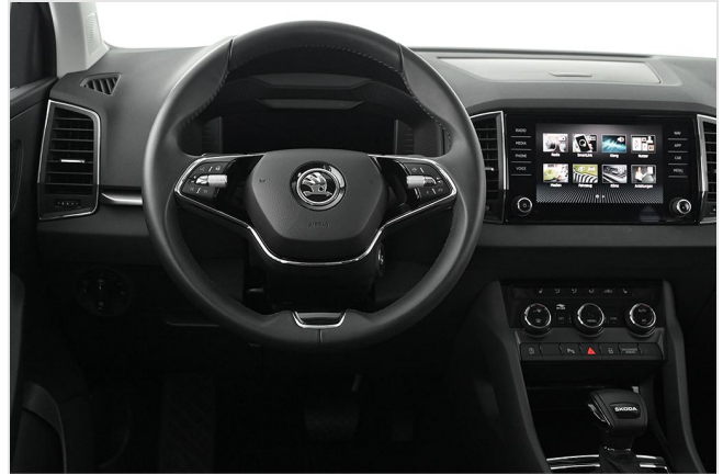
Škoda Zentrum Essen GOTTFRIED SCHULTZ