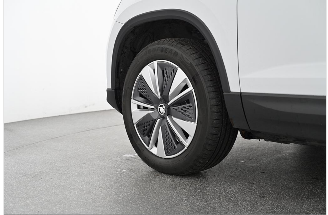
Škoda Zentrum Essen GOTTFRIED SCHULTZ