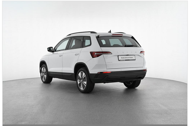
Škoda Zentrum Essen GOTTFRIED SCHULTZ