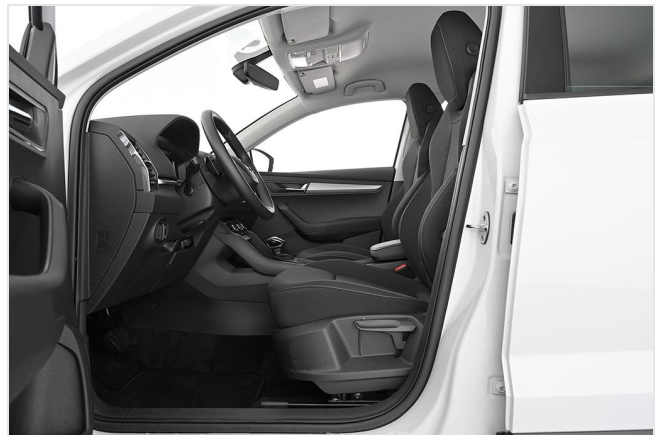
Škoda Zentrum Essen GOTTFRIED SCHULTZ