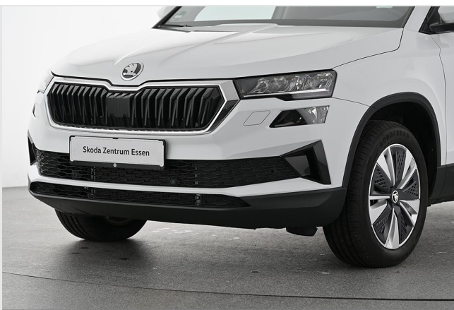
Škoda Zentrum Essen GOTTFRIED SCHULTZ