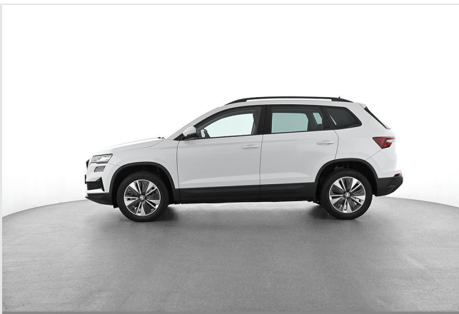
Škoda Zentrum Essen GOTTFRIED SCHULTZ