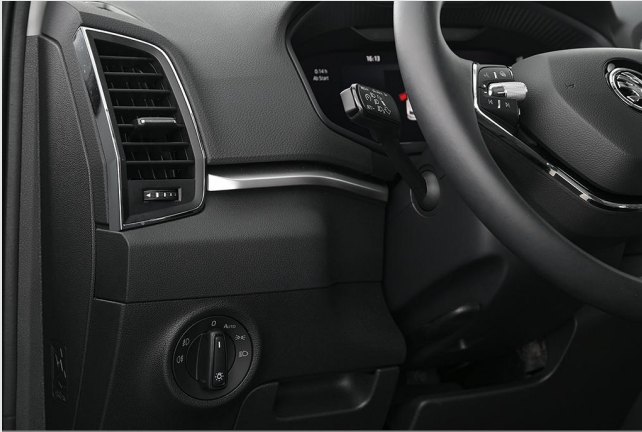
Škoda Zentrum Essen GOTTFRIED SCHULTZ

Angebotsnummer: 81465 Ausdruck vom: 27.04.2024