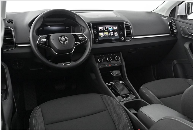
Škoda Zentrum Essen GOTTFRIED SCHULTZ

Angebotsnummer: 81465 Ausdruck vom: 27.04.2024