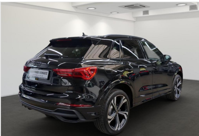
Audi Zentrum Mülheim GOTTFRIED SCHULTZ