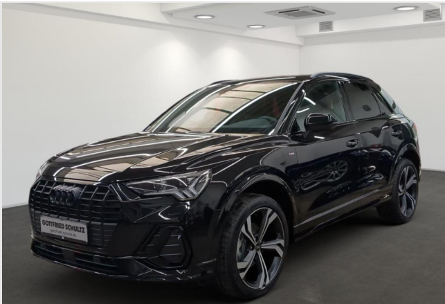
Audi Zentrum Mülheim GOTTFRIED SCHULTZ