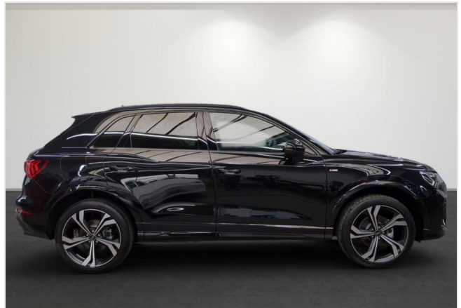
Audi Zentrum Mülheim GOTTFRIED SCHULTZ