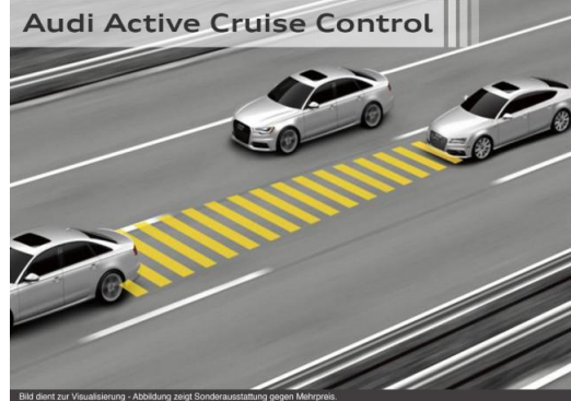
Bild dient zur Visualisierung - Abbildung zeigt Sonderausstattung gegen Mehrpreis.