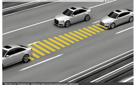
Bild dient zur Visualisierung - Abbildung zeigt Sonderausstattung gegen Mehrpreis.