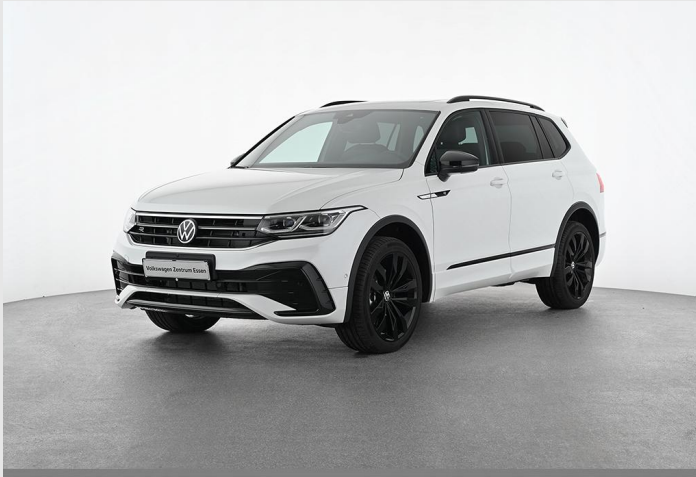
Volkswagen Zentrum Essen GOTTFRIED SCHULTZ