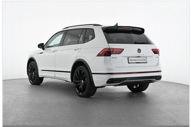
Volkswagen Zentrum Essen GOTTFRIED SCHULTZ