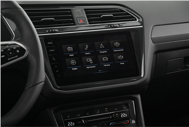
Volkswagen Zentrum Essen GOTTFRIED SCHULTZ

Angebotsnummer: 71480 Ausdruck vom: 28.04.2024