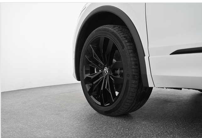
Volkswagen Zentrum Essen GOTTFRIED SCHULTZ