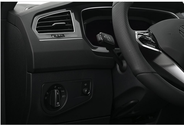
Volkswagen Zentrum Essen GOTTFRIED SCHULTZ