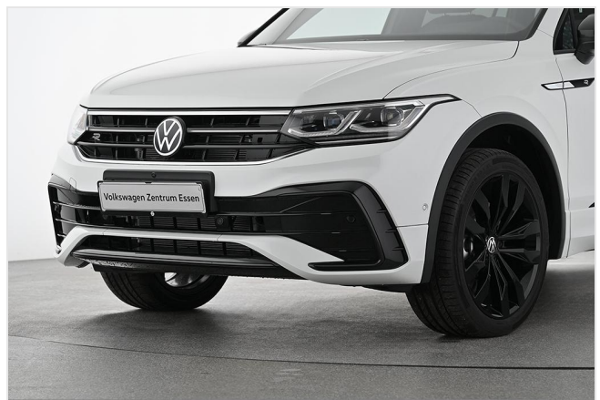
Volkswagen Zentrum Essen GOTTFRIED SCHULTZ