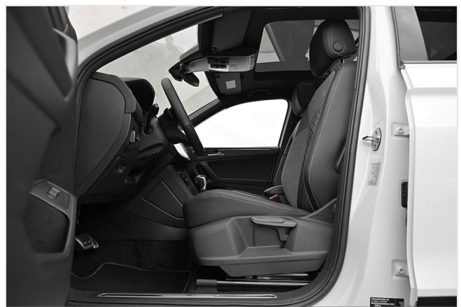
Essen-Kray GOTTFRIED SCHULTZ