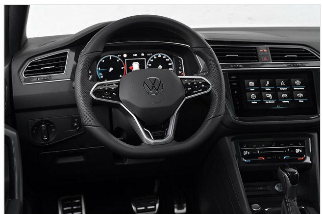
Essen-Kray GOTTFRIED SCHULTZ