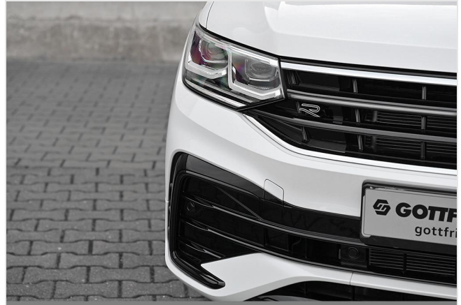
Essen-Kray GOTTFRIED SCHULTZ