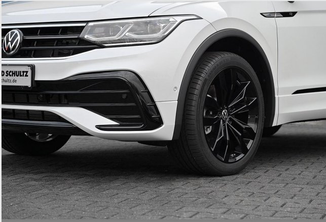
Essen-Kray GOTTFRIED SCHULTZ

Angebotsnummer: 73112 Ausdruck vom: 29.04.2024