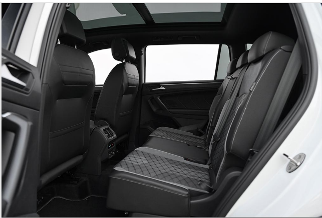
Essen-Kray GOTTFRIED SCHULTZ