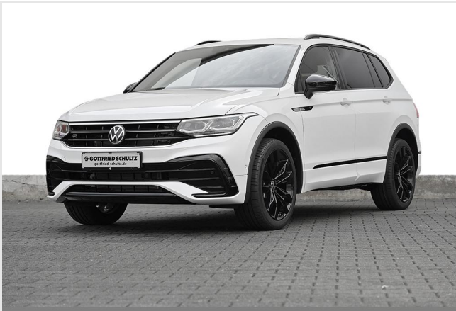
Essen-Kray GOTTFRIED SCHULTZ