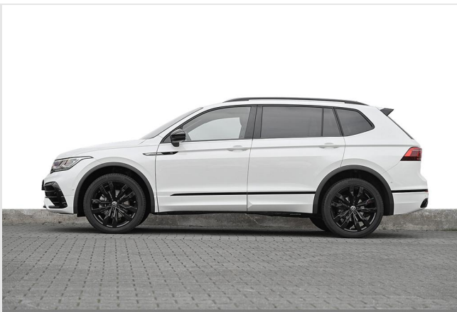
Essen-Kray GOTTFRIED SCHULTZ