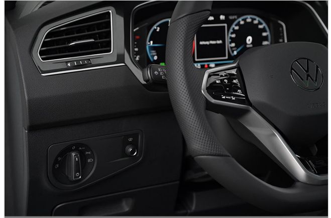
Essen-Kray GOTTFRIED SCHULTZ