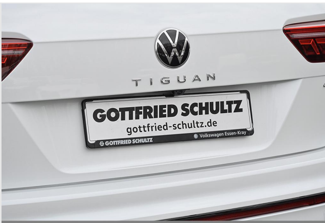
Essen-Kray GOTTFRIED SCHULTZ