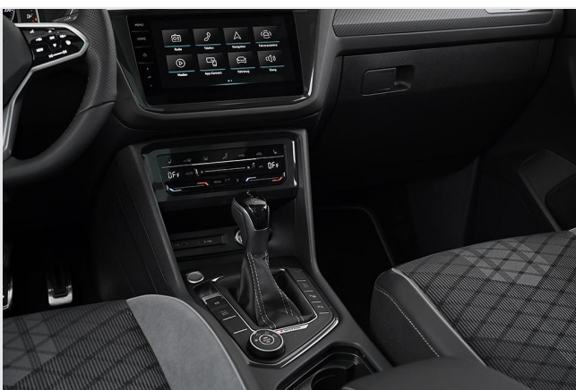
Essen-Kray GOTTFRIED SCHULTZ