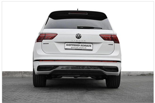
Essen-Kray GOTTFRIED SCHULTZ