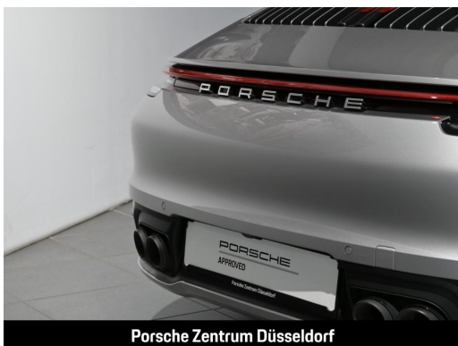
Porsche Zentrum Düsseldorf