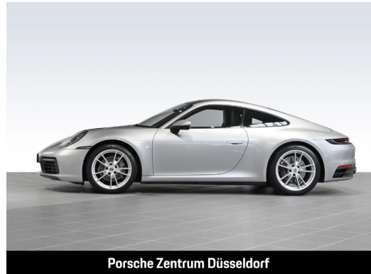
Porsche Zentrum Düsseldorf