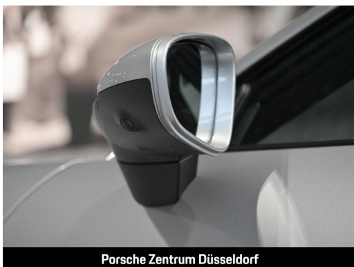
Porsche Zentrum Düsseldorf