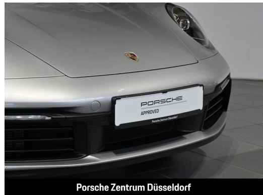
Porsche Zentrum Düsseldorf