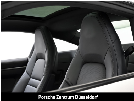
Porsche Zentrum Düsseldorf