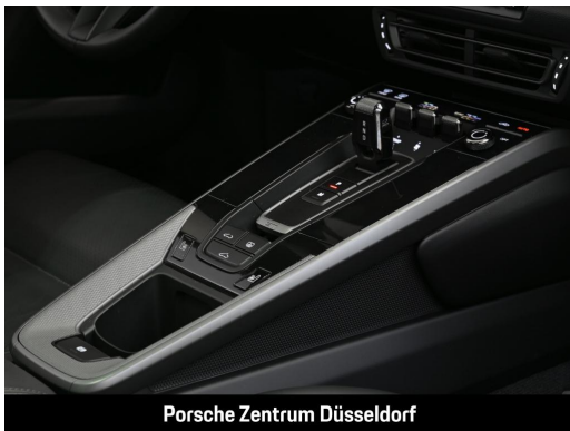
Porsche Zentrum Düsseldorf