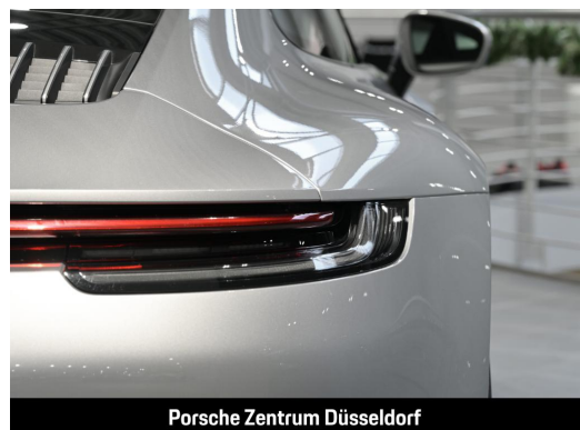
Porsche Zentrum Düsseldorf