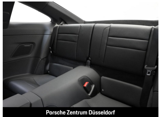
Porsche Zentrum Düsseldorf