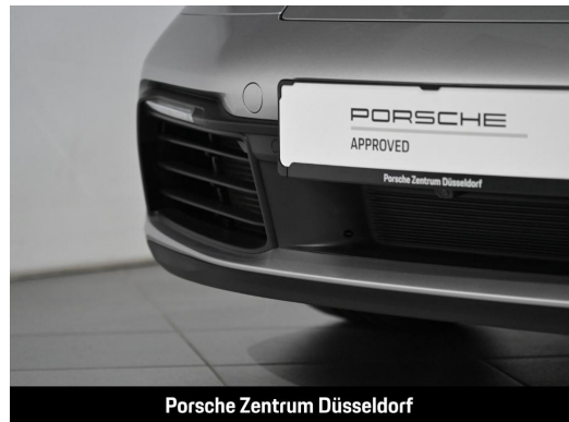
Porsche Zentrum Düsseldorf