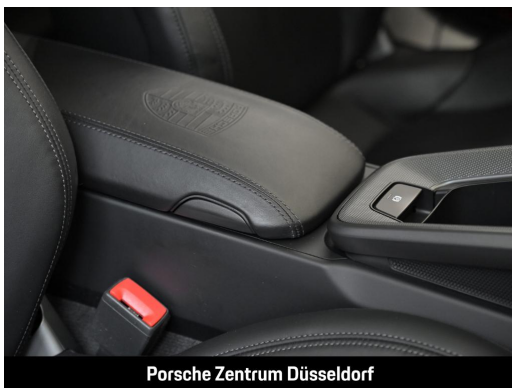
Porsche Zentrum Düsseldorf