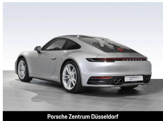
Porsche Zentrum Düsseldorf