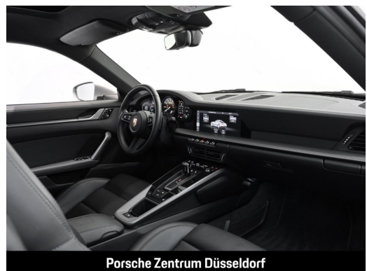
Porsche Zentrum Düsseldorf