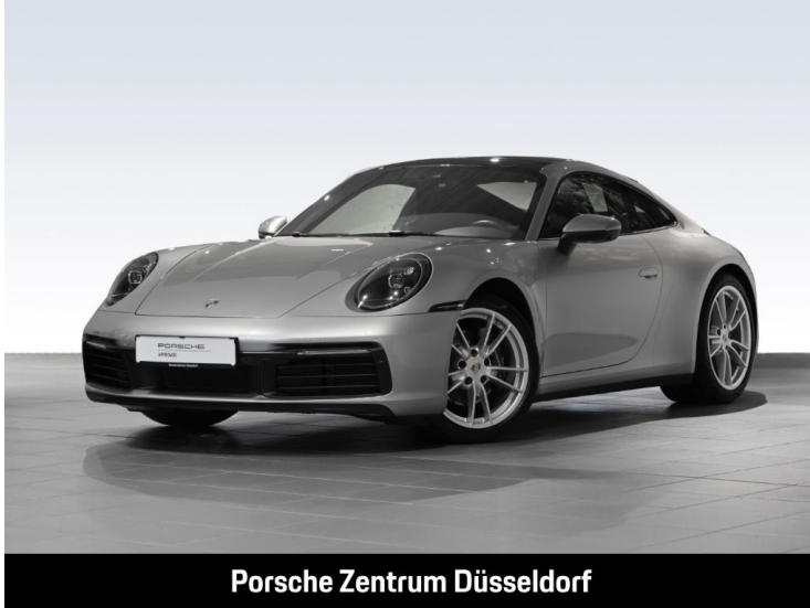
Porsche Zentrum Düsseldorf