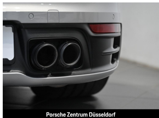
Porsche Zentrum Düsseldorf