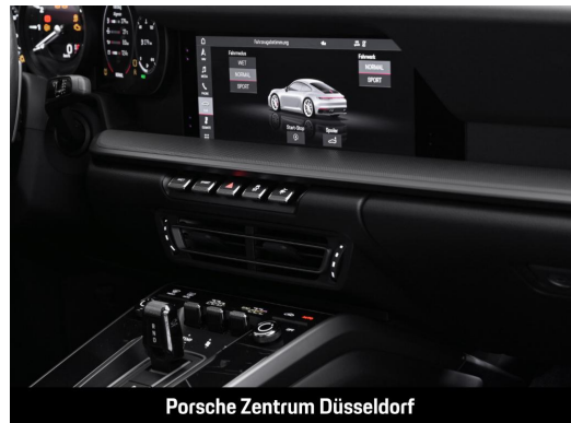
Porsche Zentrum Düsseldorf