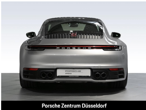
Porsche Zentrum Düsseldorf