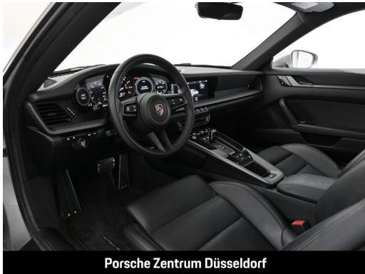
Porsche Zentrum Düsseldorf