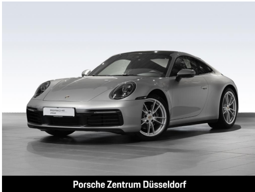
Porsche Zentrum Düsseldorf