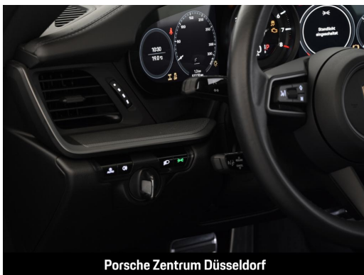
Porsche Zentrum Düsseldorf