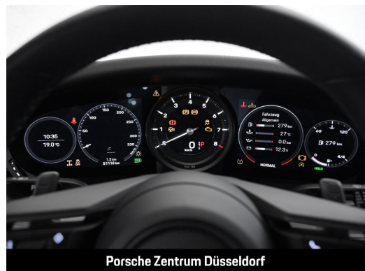
Porsche Zentrum Düsseldorf