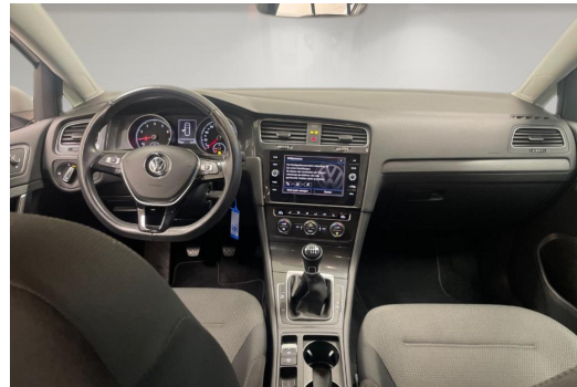
Volkswagen Zentrum Düsseldorf GOTTFRIED SCHULTZ