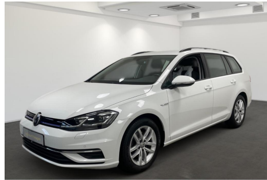
Volkswagen Zentrum Düsseldorf GOTTFRIED SCHULTZ