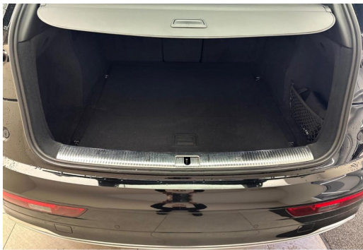
Audi Zentrum Düsseldorf GOTTFRIED SCHULTZ