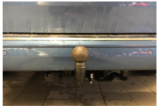
Neuss GOTTFRIED SCHULTZ