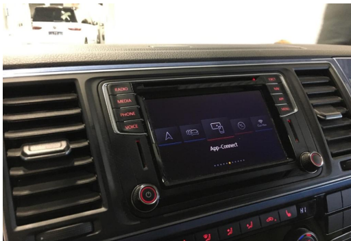
Neuss GOTTFRIED SCHULTZ