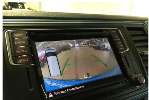
Neuss GOTTFRIED SCHULTZ