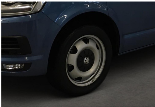
Neuss GOTTFRIED SCHULTZ