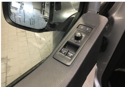
Neuss GOTTFRIED SCHULTZ