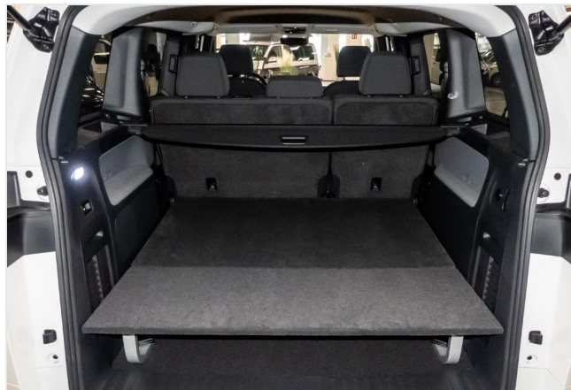
Volkswagen Zentrum Düsseldorf GOTTFRIED SCHULTZ