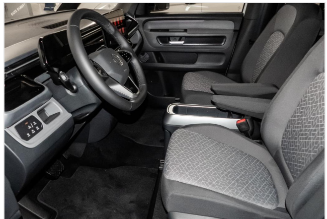
Volkswagen Zentrum Düsseldorf GOTTFRIED SCHULTZ