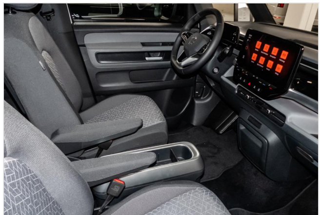
Volkswagen Zentrum Düsseldorf GOTTFRIED SCHULTZ