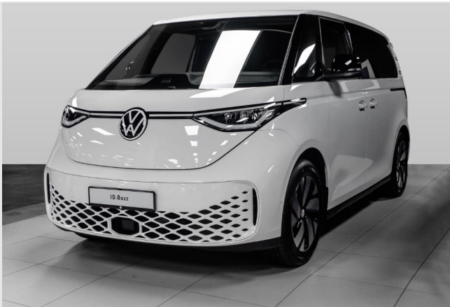
Volkswagen Zentrum Düsseldorf GOTTFRIED SCHULTZ