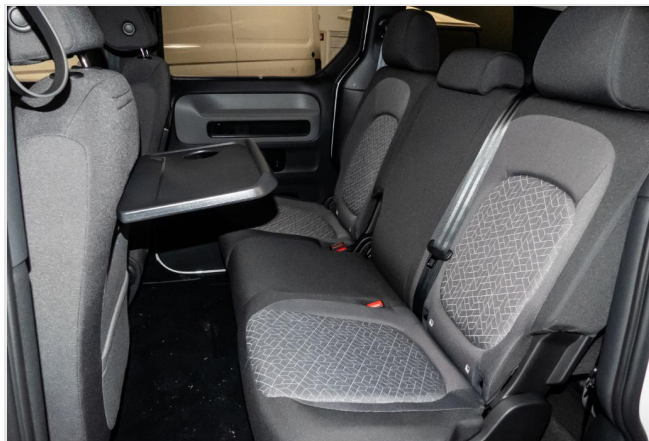
Volkswagen Zentrum Düsseldorf GOTTFRIED SCHULTZ

Angebotsnummer: 52046 Ausdruck vom: 29.04.2024