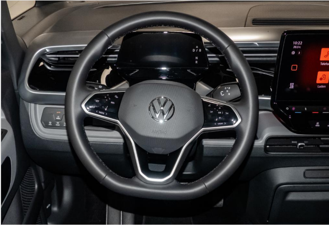
Volkswagen Zentrum Düsseldorf GOTTFRIED SCHULTZ

Angebotsnummer: 52046 Ausdruck vom: 29.04.2024