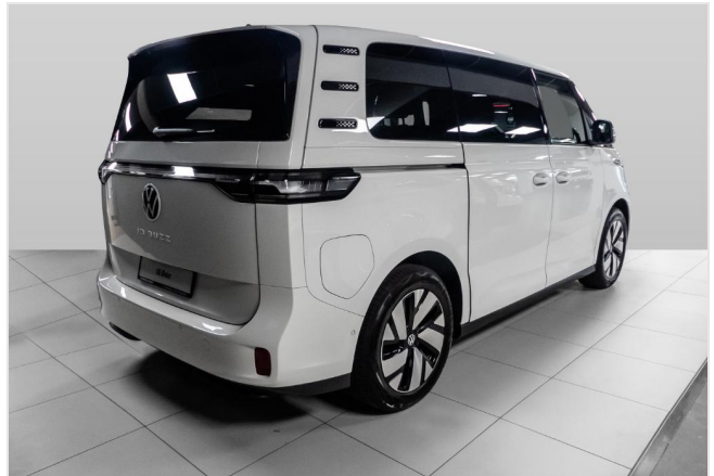
Volkswagen Zentrum Düsseldorf GOTTFRIED SCHULTZ