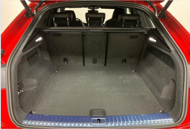
Hagen GOTTFRIED SCHULTZ

Angebotsnummer: 90983 Ausdruck vom: 27.04.2024