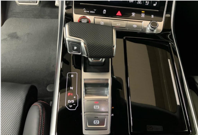
Hagen GOTTFRIED SCHULTZ

Angebotsnummer: 90983 Ausdruck vom: 27.04.2024