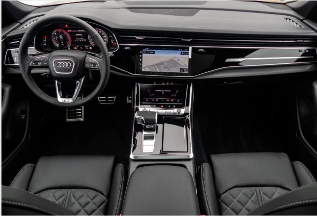
Velbert GOTTFRIED SCHULTZ

Angebotsnummer: 45498 Ausdruck vom: 27.04.2024