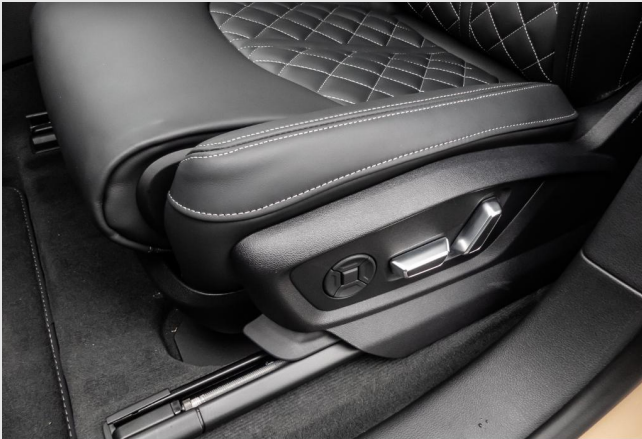
Velbert GOTTFRIED SCHULTZ

Angebotsnummer: 45498 Ausdruck vom: 27.04.2024