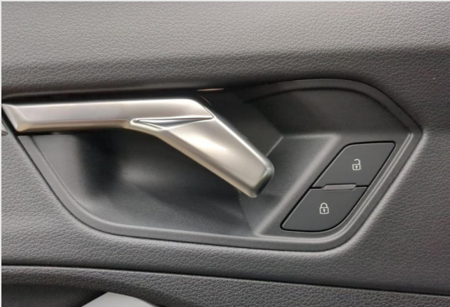
Audi Zentrum Mülheim GOTTFRIED SCHULTZ

Angebotsnummer: 12621 Ausdruck vom: 29.04.2024