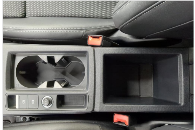
Audi Zentrum Mülheim GOTTFRIED SCHULTZ