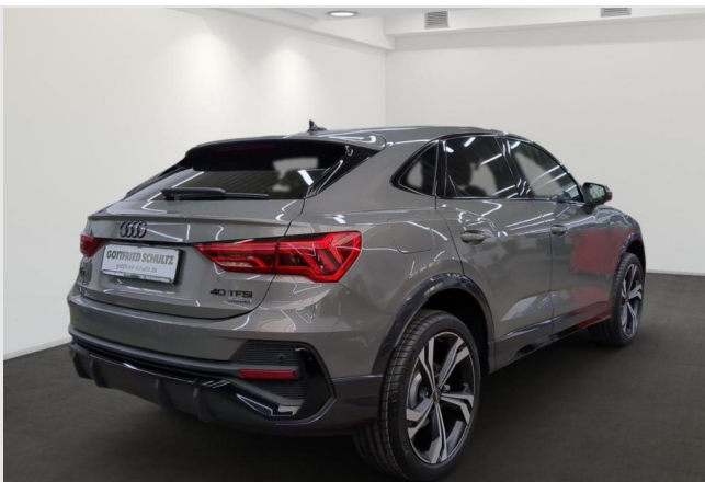
Audi Zentrum Mülheim GOTTFRIED SCHULTZ