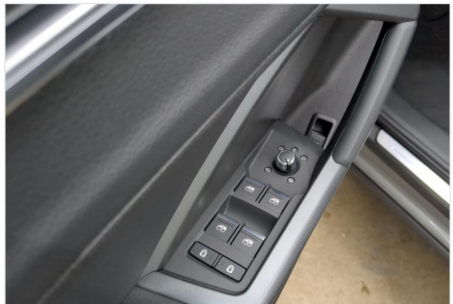
Audi Zentrum Mülheim GOTTFRIED SCHULTZ