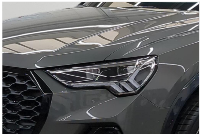
Audi Zentrum Mülheim GOTTFRIED SCHULTZ