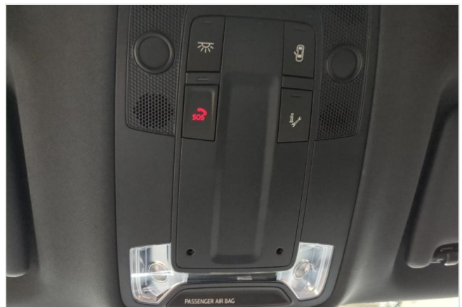
Audi Zentrum Mülheim GOTTFRIED SCHULTZ