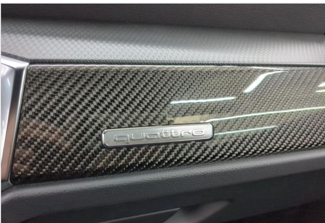
Audi Zentrum Mülheim GOTTFRIED SCHULTZ