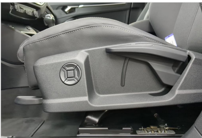
Audi Zentrum Mülheim GOTTFRIED SCHULTZ