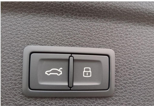
Audi Zentrum Mülheim GOTTFRIED SCHULTZ