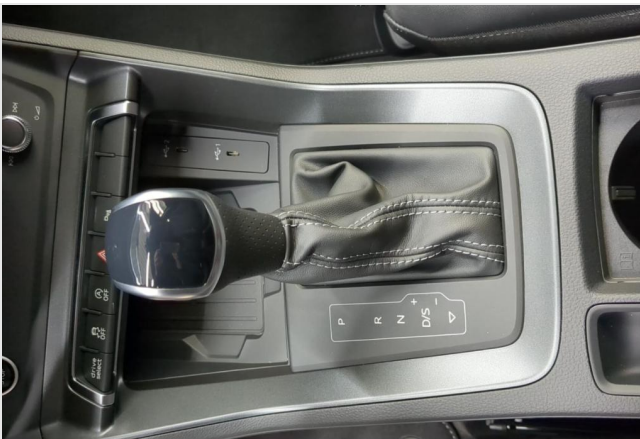
Audi Zentrum Mülheim GOTTFRIED SCHULTZ