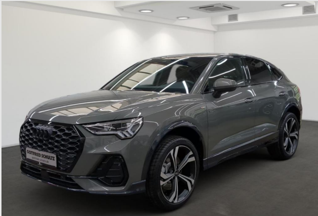
Audi Zentrum Mülheim GOTTFRIED SCHULTZ