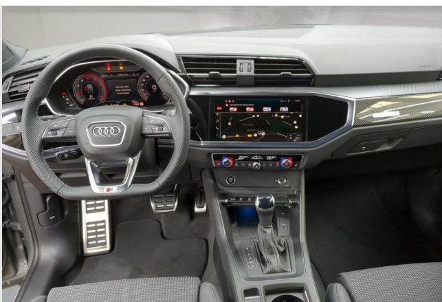
Audi Zentrum Mülheim GOTTFRIED SCHULTZ