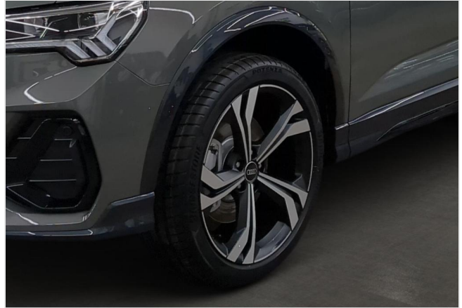
Audi Zentrum Mülheim GOTTFRIED SCHULTZ