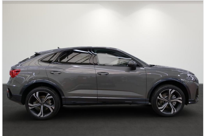
Audi Zentrum Mülheim GOTTFRIED SCHULTZ