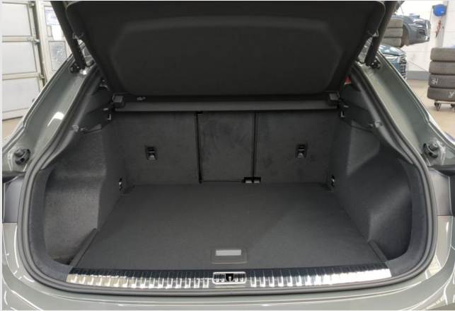
Audi Zentrum Mülheim GOTTFRIED SCHULTZ

Angebotsnummer: 12621 Ausdruck vom: 29.04.2024