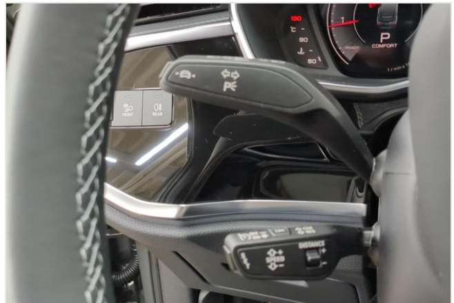
Audi Zentrum Mülheim GOTTFRIED SCHULTZ