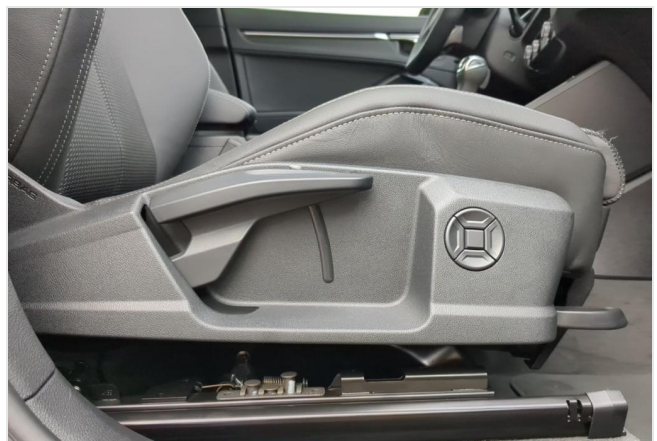
Audi Zentrum Mülheim GOTTFRIED SCHULTZ