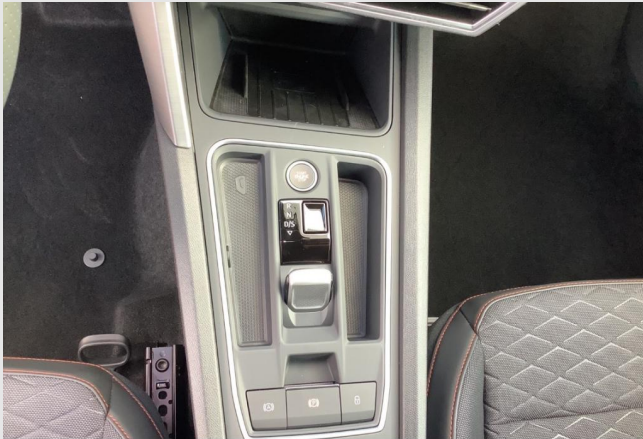
Düsseldorf-Benrath GOTTFRIED SCHULTZ

Angebotsnummer: 53605 Ausdruck vom: 28.04.2024