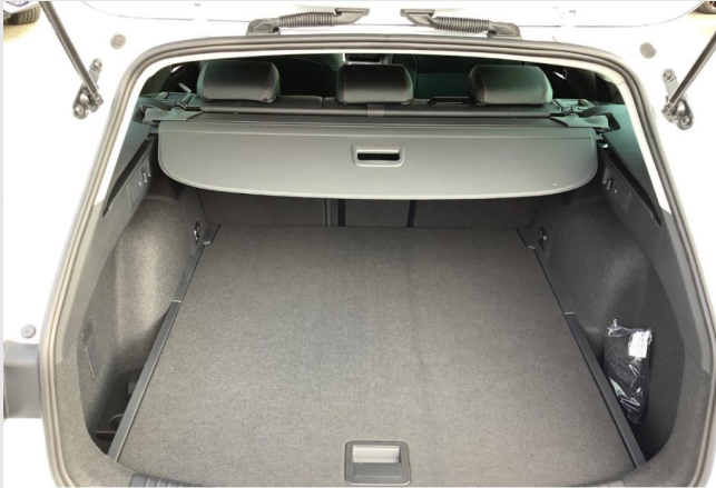
Düsseldorf-Benrath GOTTFRIED SCHULTZ

Angebotsnummer: 53605 Ausdruck vom: 28.04.2024