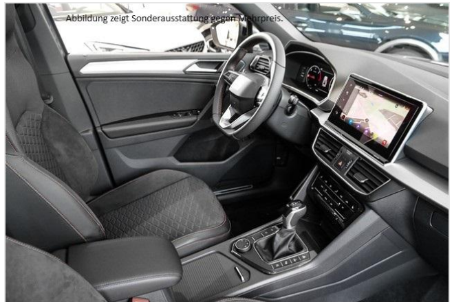
Abbildung zeigt Sonderausstattung gegen Mehrpreis.