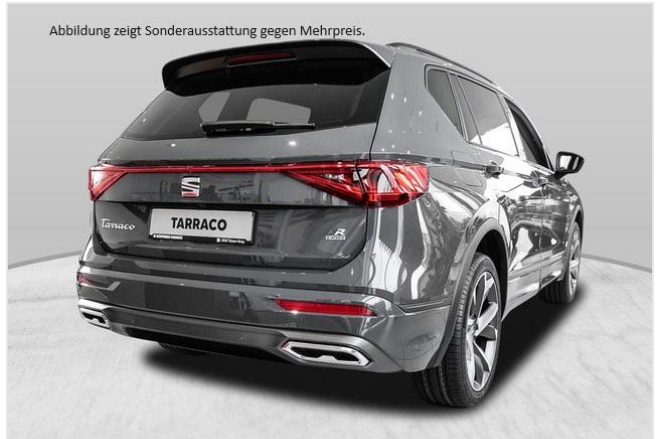
Abbildung zeigt Sonderausstattung gegen Mehrpreis.