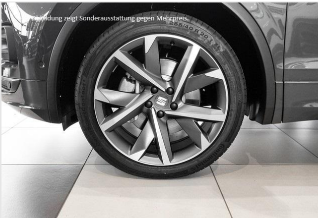
Abbildung zeigt Sonderausstattung gegen Mehrpreis.