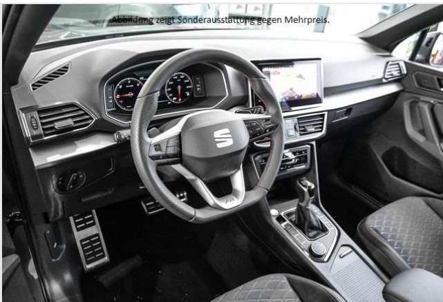
Abbildung zeigt Sonderausstattung gegen Mehrpreis.