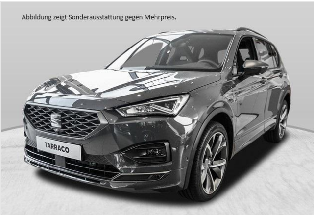
Abbildung zeigt Sonderausstattung gegen Mehrpreis.