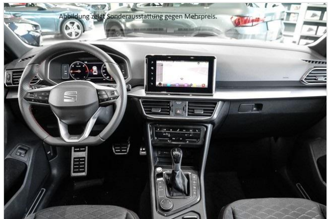
Abbildung zeigt Sonderausstattung gegen Mehrpreis.