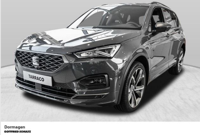
Abbildung zeigt Sonderausstattung gegen Mehrpreis.