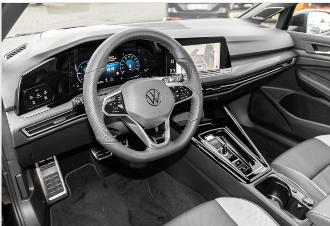
Grevenbroich GOTTFRIED SCHULTZ