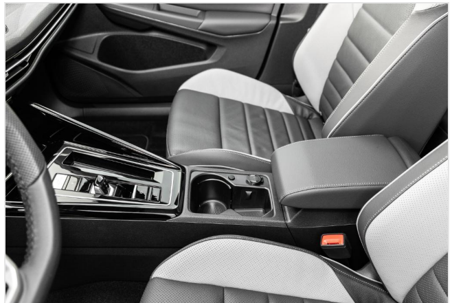
Grevenbroich GOTTFRIED SCHULTZ