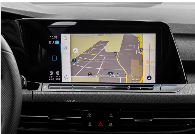
Grevenbroich GOTTFRIED SCHULTZ