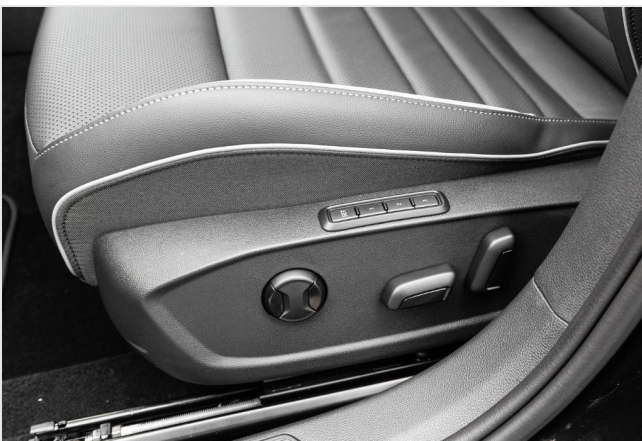
Grevenbroich GOTTFRIED SCHULTZ