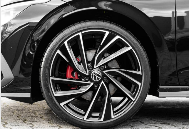
Grevenbroich GOTTFRIED SCHULTZ

Angebotsnummer: 99461 Ausdruck vom: 28.04.2024