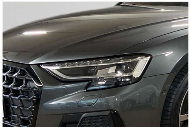
Audi Zentrum Neuss GOTTFRIED SCHULTZ