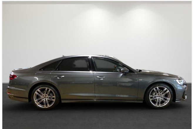
Audi Zentrum Neuss GOTTFRIED SCHULTZ