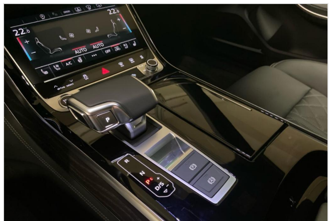
Audi Zentrum Neuss GOTTFRIED SCHULTZ