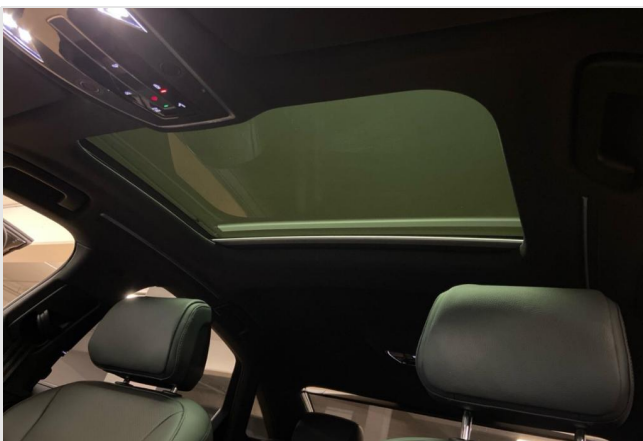
Audi Zentrum Neuss GOTTFRIED SCHULTZ