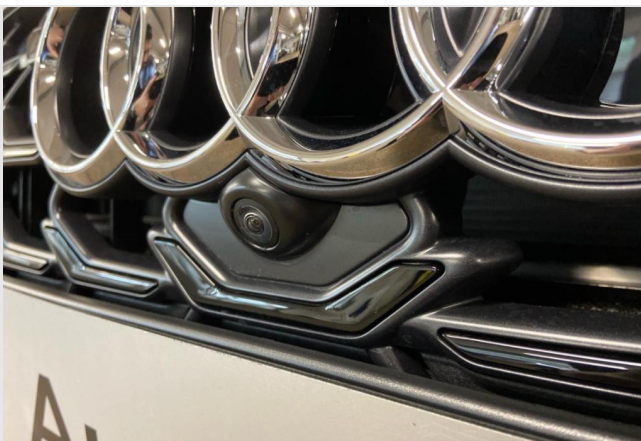
Audi Zentrum Neuss GOTTFRIED SCHULTZ