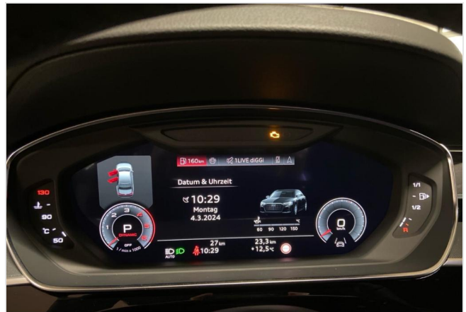
Audi Zentrum Neuss GOTTFRIED SCHULTZ