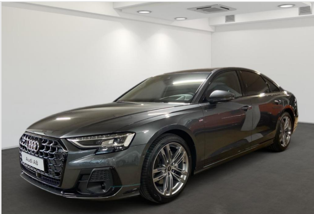
Audi Zentrum Neuss GOTTFRIED SCHULTZ