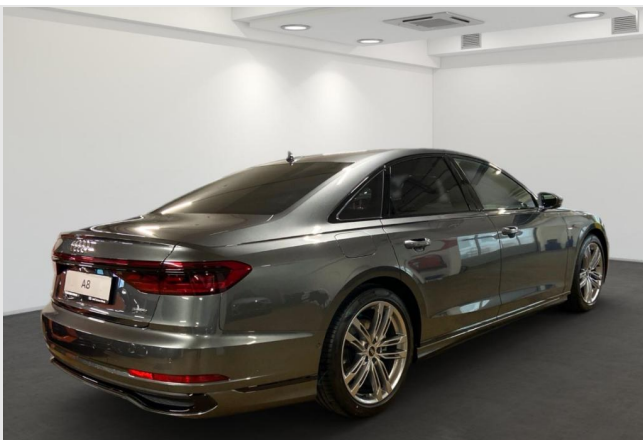
Audi Zentrum Neuss GOTTFRIED SCHULTZ