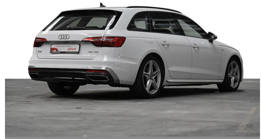
Audi Zentrum Wuppertal GOTTFRIED SCHULTZ Audi Gebrauchtwagen plus