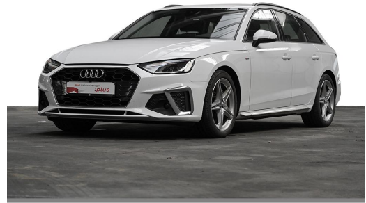
Audi Zentrum Wuppertal GOTTFRIED SCHULTZ Audi Gebrauchtwagen plus