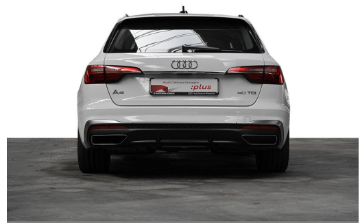
Audi Zentrum Wuppertal GOTTFRIED SCHULTZ Audi Gebrauchtwagen plus