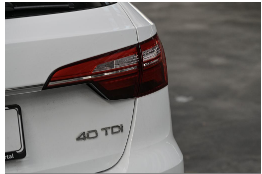
Audi Zentrum Wuppertal GOTTFRIED SCHULTZ Audi Gebrauchtwagen plus