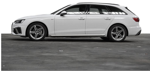
Audi Zentrum Wuppertal GOTTFRIED SCHULTZ Audi Gebrauchtwagen plus