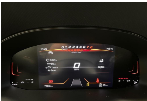
Volkswagen Zentrum Düsseldorf GOTTFRIED SCHULTZ