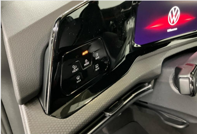
Hagen GOTTFRIED SCHULTZ

Angebotsnummer: 26269 Ausdruck vom: 27.04.2024