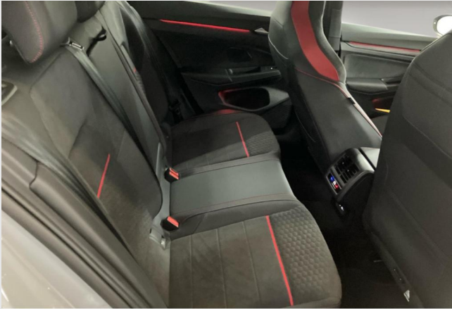
Hagen GOTTFRIED SCHULTZ

Angebotsnummer: 26269 Ausdruck vom: 27.04.2024