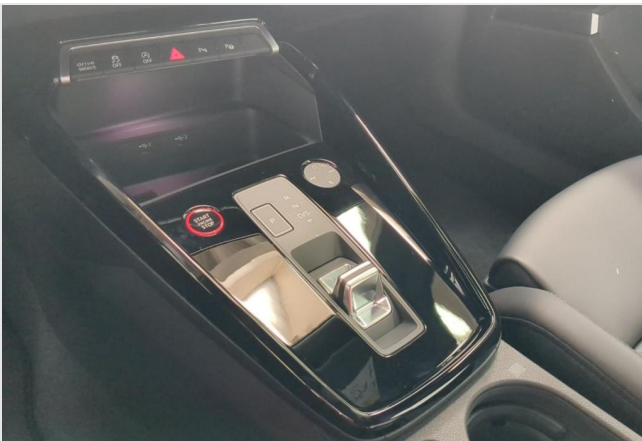
Audi Zentrum Duisburg GOTTFRIED SCHULTZ