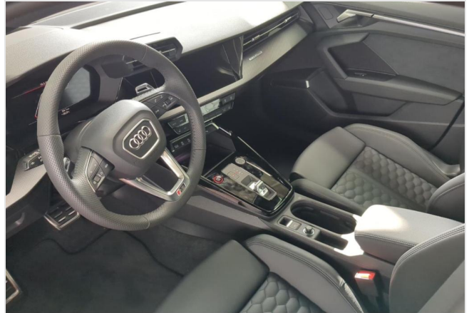
Audi Zentrum Duisburg GOTTFRIED SCHULTZ