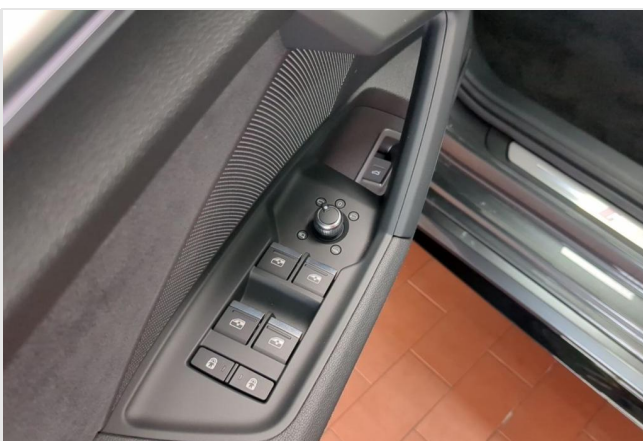
Audi Zentrum Duisburg GOTTFRIED SCHULTZ