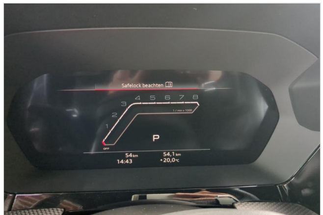
Audi Zentrum Duisburg GOTTFRIED SCHULTZ