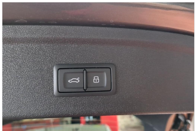
Audi Zentrum Duisburg GOTTFRIED SCHULTZ