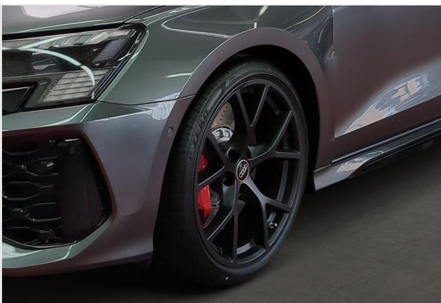
Audi Zentrum Duisburg GOTTFRIED SCHULTZ