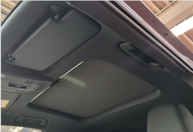
Audi Zentrum Duisburg GOTTFRIED SCHULTZ

Angebotsnummer: 41061 Ausdruck vom: 29.04.2024