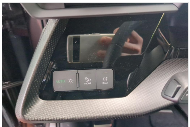
Audi Zentrum Duisburg GOTTFRIED SCHULTZ