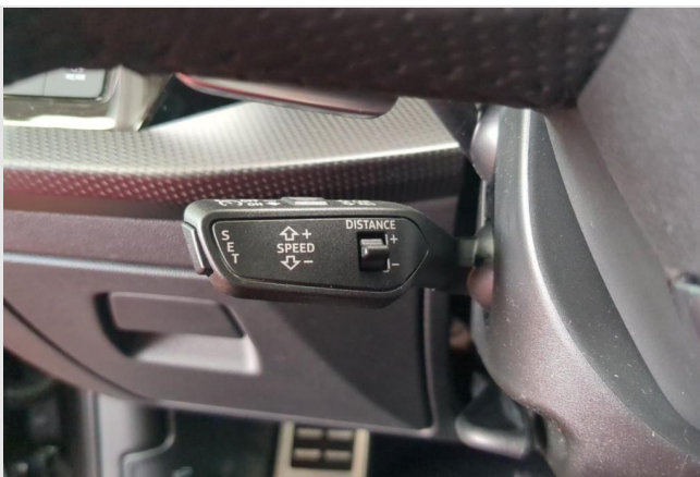
Audi Zentrum Duisburg GOTTFRIED SCHULTZ