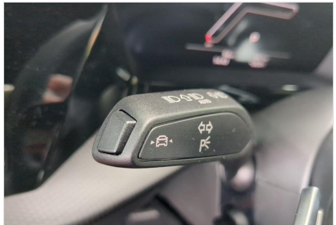
Audi Zentrum Duisburg GOTTFRIED SCHULTZ