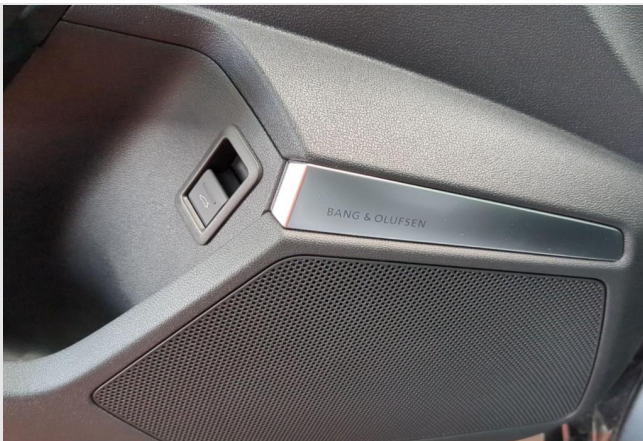
Audi Zentrum Duisburg GOTTFRIED SCHULTZ