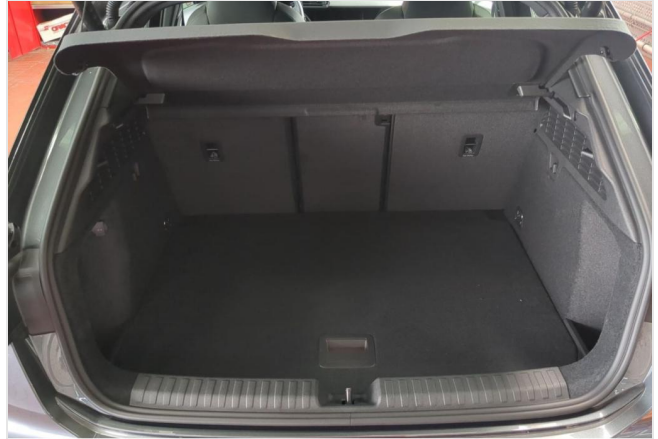
Audi Zentrum Duisburg GOTTFRIED SCHULTZ