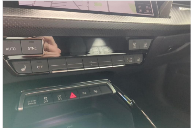
Audi Zentrum Duisburg GOTTFRIED SCHULTZ