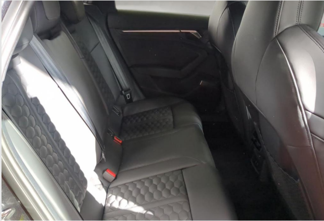
Audi Zentrum Duisburg GOTTFRIED SCHULTZ

Angebotsnummer: 41061 Ausdruck vom: 29.04.2024