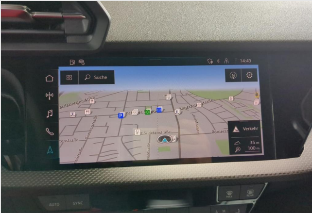
Audi Zentrum Duisburg GOTTFRIED SCHULTZ

Angebotsnummer: 41061 Ausdruck vom: 29.04.2024