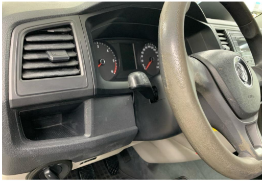
Essen-Kray GOTTFRIED SCHULTZ