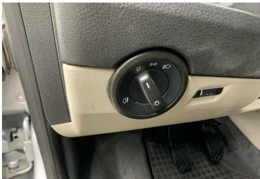
Essen-Kray GOTTFRIED SCHULTZ