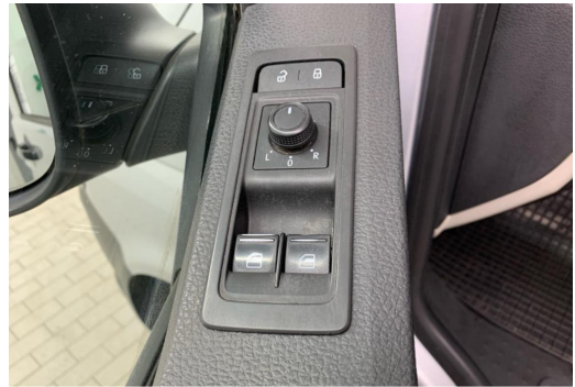
Essen-Kray GOTTFRIED SCHULTZ