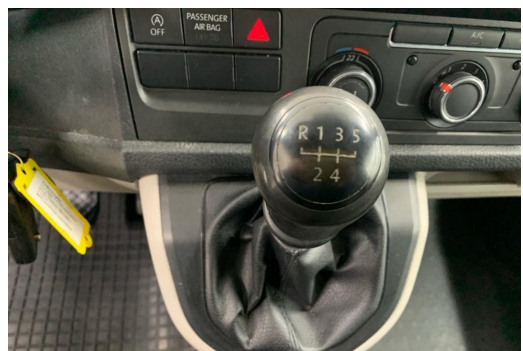
Essen-Kray GOTTFRIED SCHULTZ