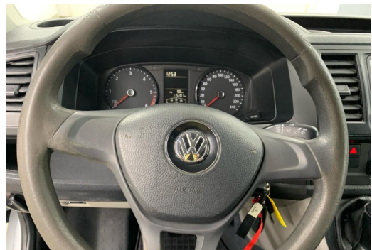
Essen-Kray GOTTFRIED SCHULTZ