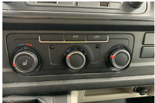
Essen-Kray GOTTFRIED SCHULTZ