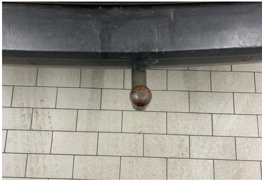
Essen-Kray GOTTFRIED SCHULTZ