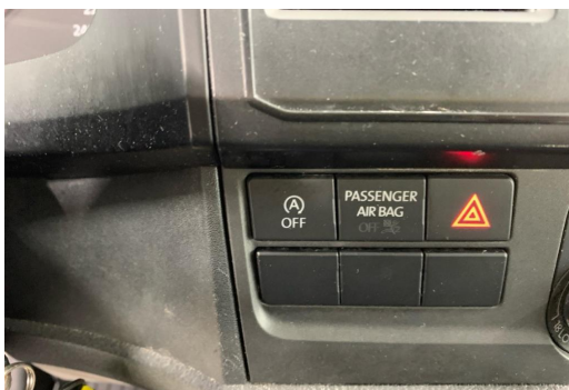
Essen-Kray GOTTFRIED SCHULTZ