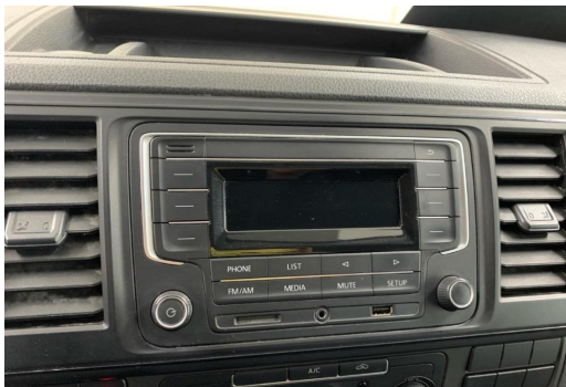
Essen-Kray GOTTFRIED SCHULTZ