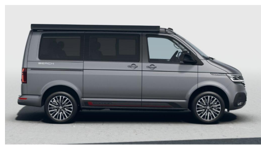
Eszen-Kray GOTTFRIED SCHULTZ