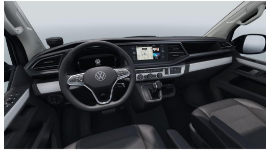
Eszen-Kray GOTTFRIED SCHULTZ