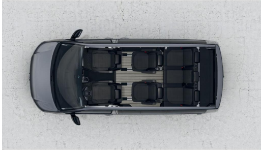
Eszen-Kray GOTTFRIED SCHULTZ