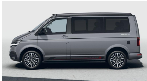
Eszen-Kray GOTTFRIED SCHULTZ