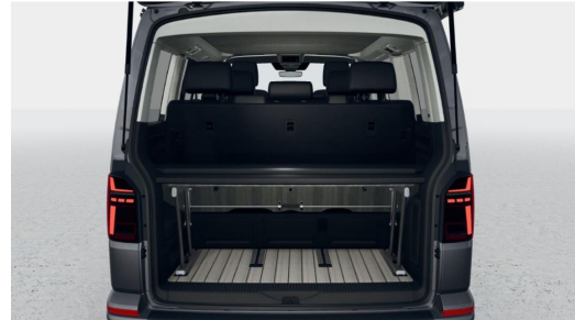
Eszen-Kray GOTTFRIED SCHULTZ