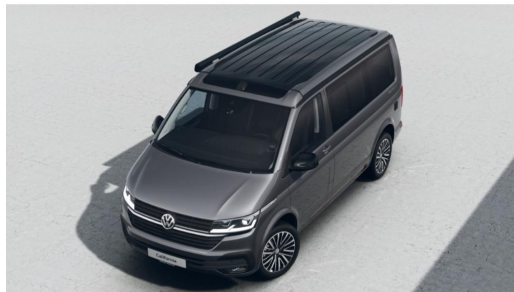
Eszen-Kray GOTTFRIED SCHULTZ