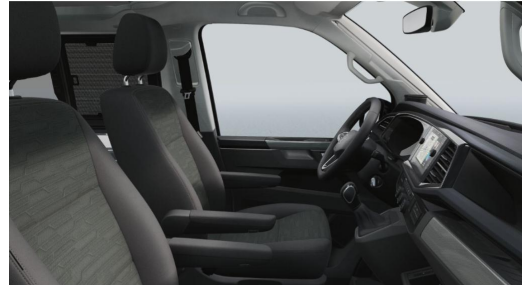
Eszen-Kray GOTTFRIED SCHULTZ