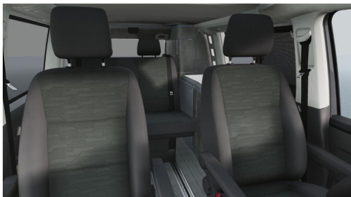
Eszen-Kray GOTTFRIED SCHULTZ