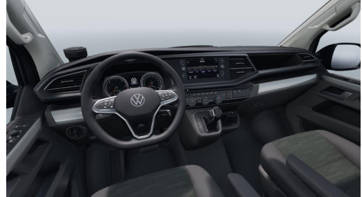
Eszen-Kray GOTTFRIED SCHULTZ