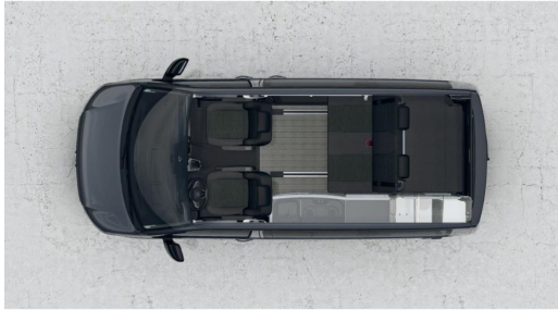
Eszen-Kray GOTTFRIED SCHULTZ