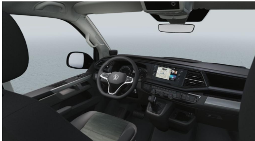
Eszen-Kray GOTTFRIED SCHULTZ