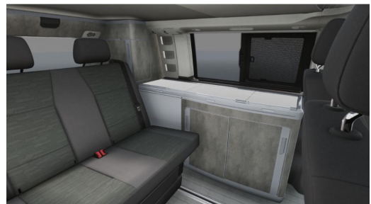
Eszen-Kray GOTTFRIED SCHULTZ