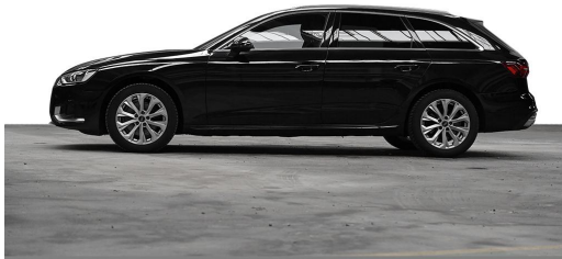
Audi Zentrum Wuppertal GOTTFRIED SCHULTZ