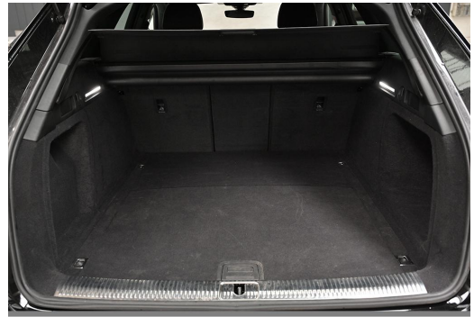
Audi Zentrum Wuppertal GOTTFRIED SCHULTZ