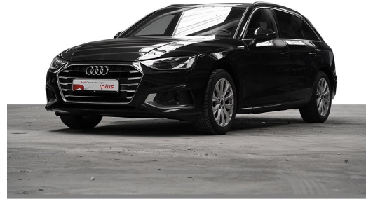
Audi Zentrum Wuppertal GOTTFRIED SCHULTZ