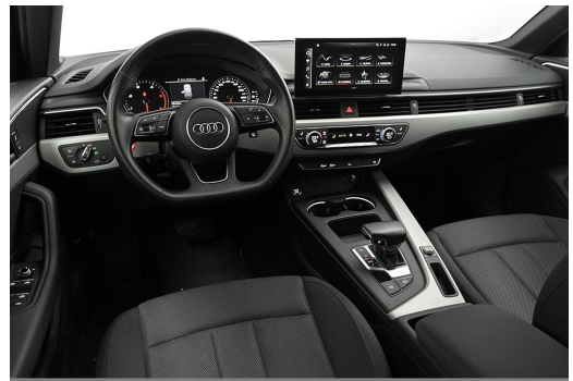
Audi Zentrum Wuppertal GOTTFRIED SCHULTZ