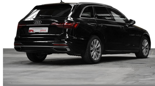
Audi Zentrum Wuppertal GOTTFRIED SCHULTZ