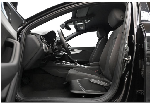
Audi Zentrum Wuppertal GOTTFRIED SCHULTZ