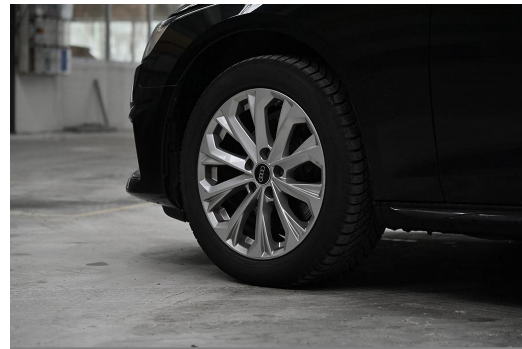
Audi Zentrum Wuppertal GOTTFRIED SCHULTZ