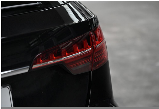
Audi Zentrum Wuppertal GOTTFRIED SCHULTZ