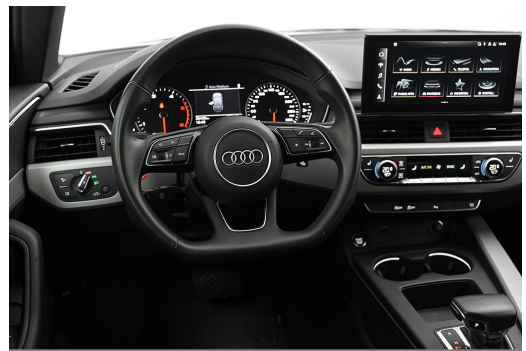
Audi Zentrum Wuppertal GOTTFRIED SCHULTZ