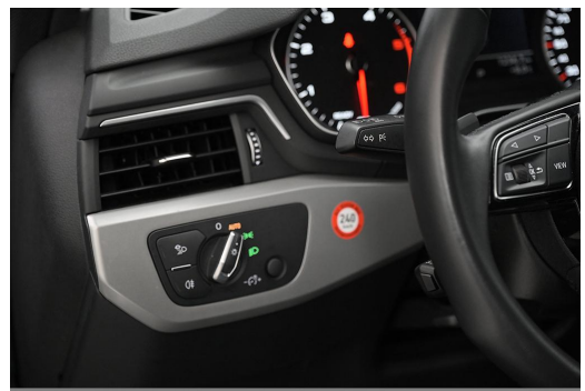
Audi Zentrum Wuppertal GOTTFRIED SCHULTZ