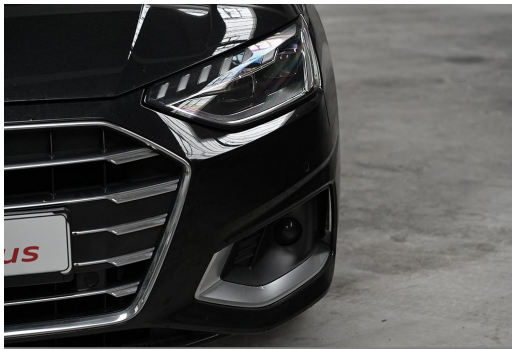
Audi Zentrum Wuppertal GOTTFRIED SCHULTZ