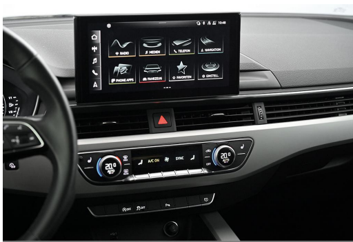
Audi Zentrum Wuppertal GOTTFRIED SCHULTZ