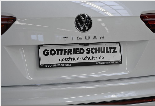
Velbert GOTTFRIED SCHULTZ

Angebotsnummer: 43232 Ausdruck vom: 29.04.2024