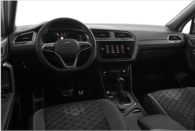
Velbert GOTTFRIED SCHULTZ

Angebotsnummer: 43232 Ausdruck vom: 29.04.2024