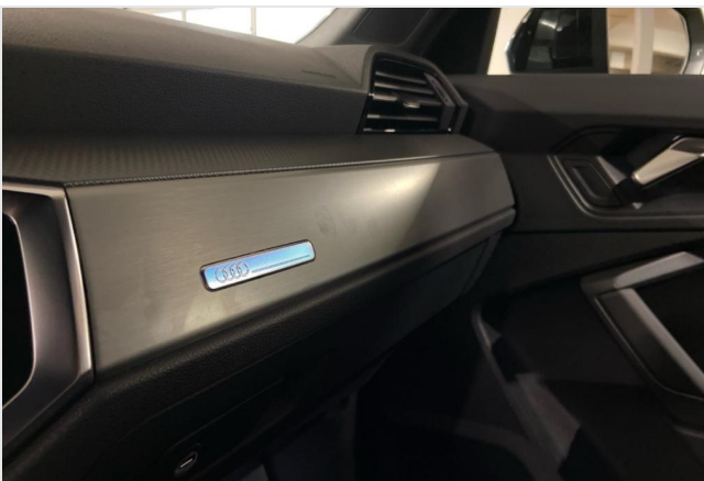
Audi Zentrum Neuss GOTTFRIED SCHULTZ