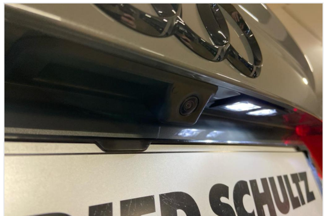
Audi Zentrum Neuss GOTTFRIED SCHULTZ