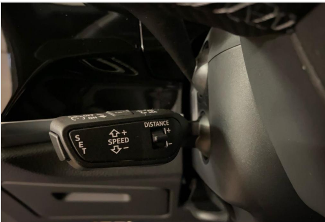
Audi Zentrum Neuss GOTTFRIED SCHULTZ