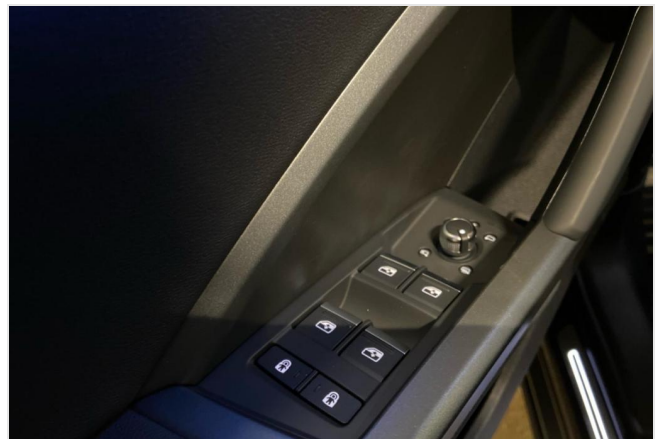
Audi Zentrum Neuss GOTTFRIED SCHULTZ