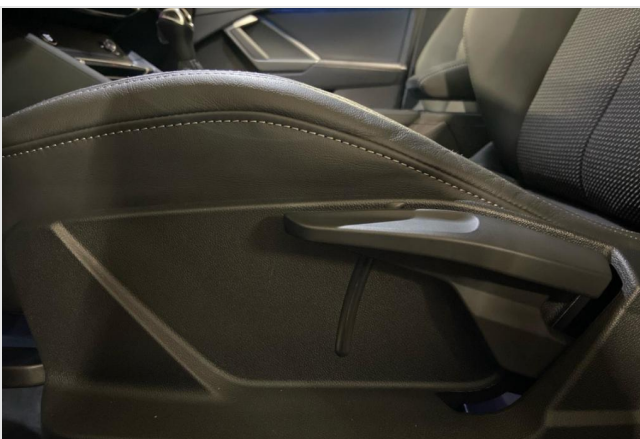
Audi Zentrum Neuss GOTTFRIED SCHULTZ