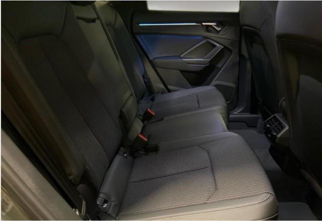
Audi Zentrum Neuss GOTTFRIED SCHULTZ

Angebotsnummer: 90572 Ausdruck vom: 28.04.2024