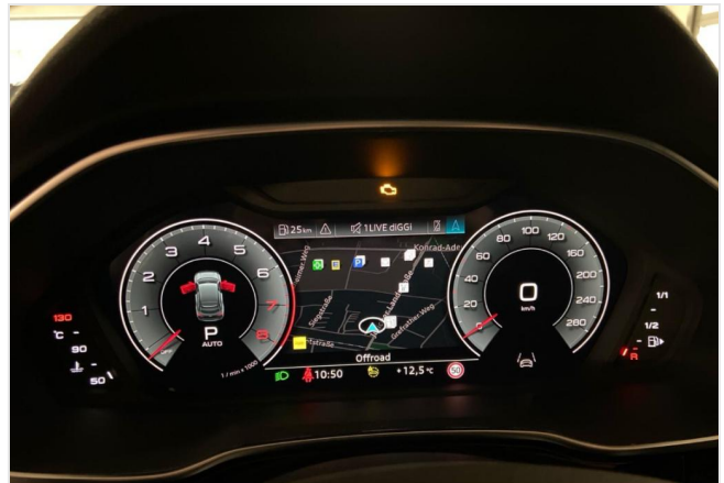
Audi Zentrum Neuss GOTTFRIED SCHULTZ