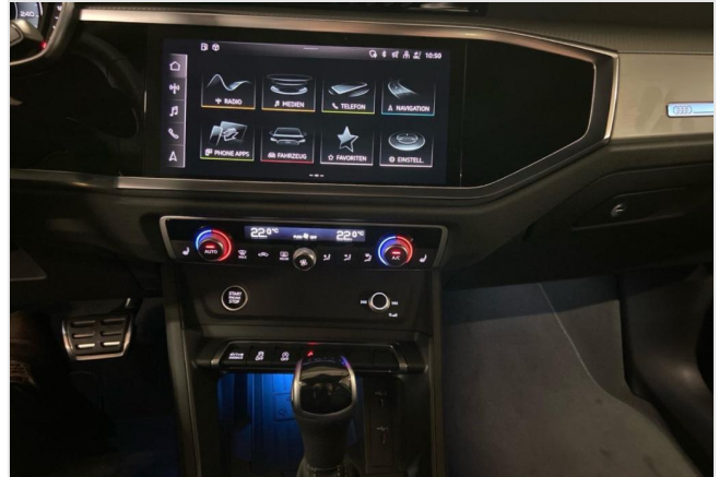
Audi Zentrum Neuss GOTTFRIED SCHULTZ