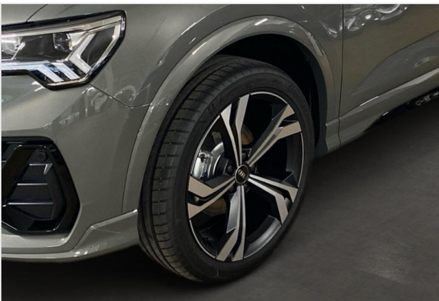
Audi Zentrum Neuss GOTTFRIED SCHULTZ