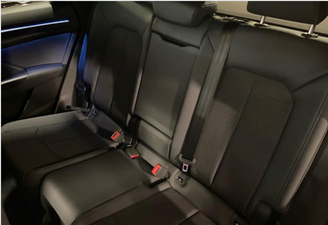
Audi Zentrum Neuss GOTTFRIED SCHULTZ

Angebotsnummer: 90572 Ausdruck vom: 28.04.2024