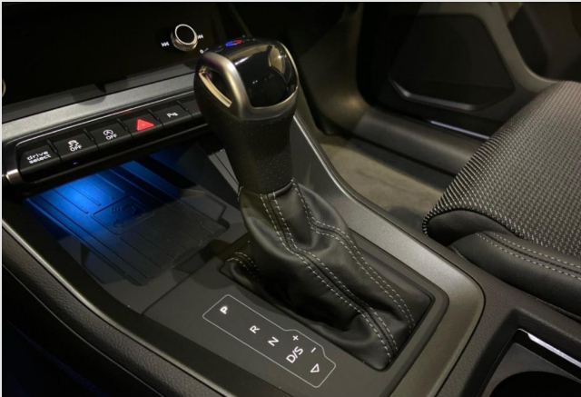
Audi Zentrum Neuss GOTTFRIED SCHULTZ

Angebotsnummer: 90572 Ausdruck vom: 28.04.2024