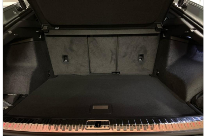
Audi Zentrum Neuss GOTTFRIED SCHULTZ