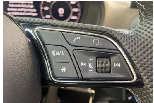
Mülheim GOTTFRIED SCHULTZ