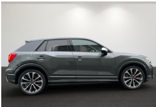
Mülheim GOTTFRIED SCHULTZ