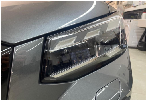
Mülheim GOTTFRIED SCHULTZ