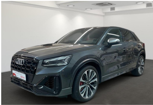
Mülheim GOTTFRIED SCHULTZ