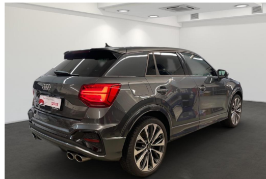
Mülheim GOTTFRIED SCHULTZ