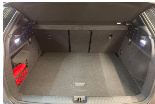
Mülheim GOTTFRIED SCHULTZ