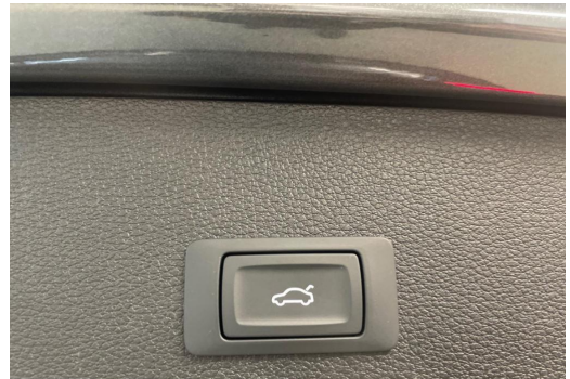
Mülheim GOTTFRIED SCHULTZ