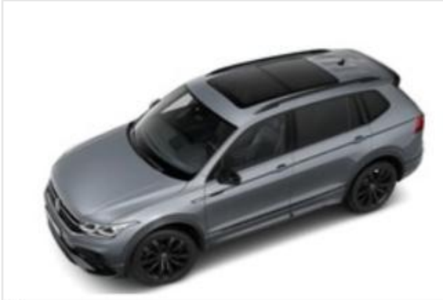
Hagen GOTTFRIED SCHULTZ

Angebotsnummer: 90571 Ausdruck vom: 28.04.2024