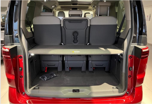
Auto Wolf GOTTFRIED SCHULTZ

Angebotsnummer: 52850 Ausdruck vom: 27.04.2024