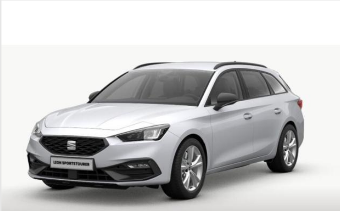
Düsseldorf-Automeile GOTTFRIED SCHULTZ