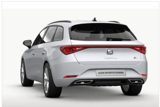
Düsseldorf-Automeile GOTTFRIED SCHULTZ