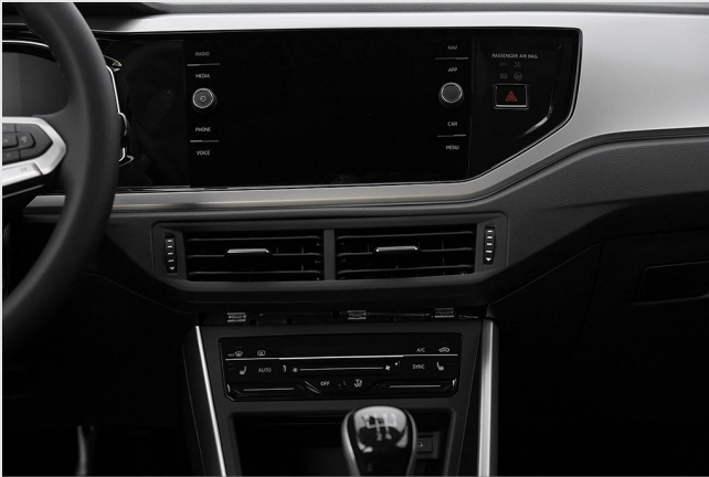
Velbert GOTTFRIED SCHULTZ

Angebotsnummer: 43447 Ausdruck vom: 27.04.2024