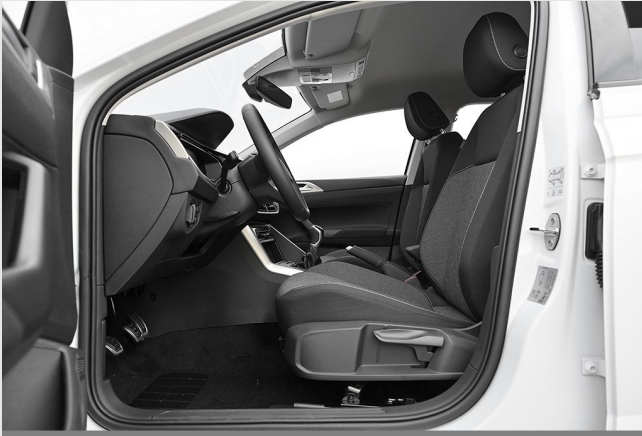
Velbert GOTTFRIED SCHULTZ

Angebotsnummer: 43447 Ausdruck vom: 27.04.2024