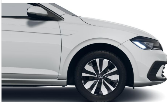
Grevenbroich GOTTFRIED SCHULTZ

Angebotsnummer: 99933 Ausdruck vom: 27.04.2024