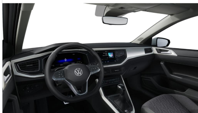
Grevenbroich GOTTFRIED SCHULTZ