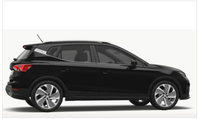
Düsseldorf-Automeile GOTTFRIED SCHULTZ