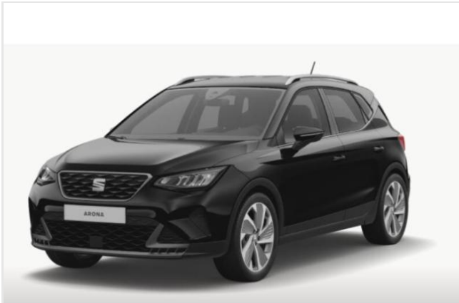
Düsseldorf-Automeile GOTTFRIED SCHULTZ