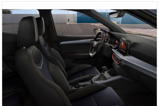
Düsseldorf-Automeile GOTTFRIED SCHULTZ