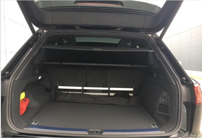
Neuss GOTTFRIED SCHULTZ

Angebotsnummer: 90605 Ausdruck vom: 27.04.2024