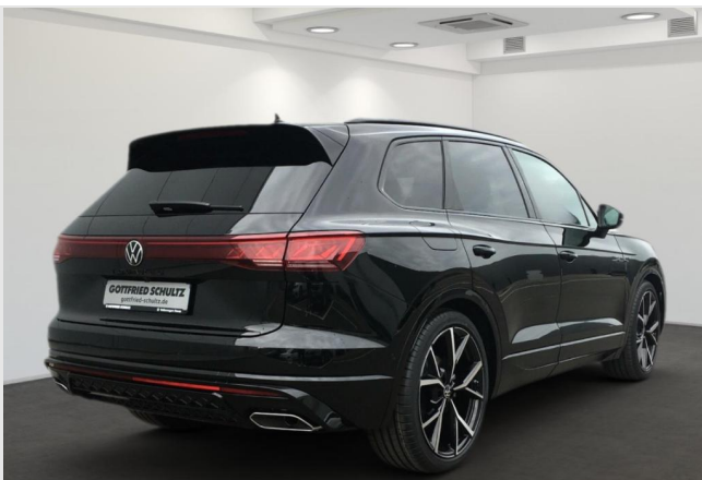
Neuss GOTTFRIED SCHULTZ