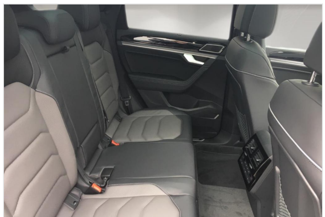
Neuss GOTTFRIED SCHULTZ