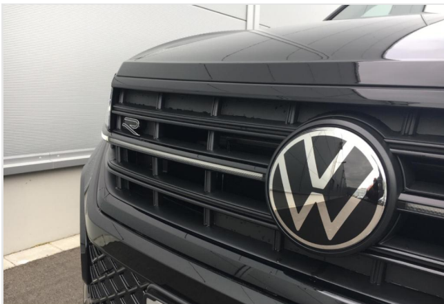
Neuss GOTTFRIED SCHULTZ