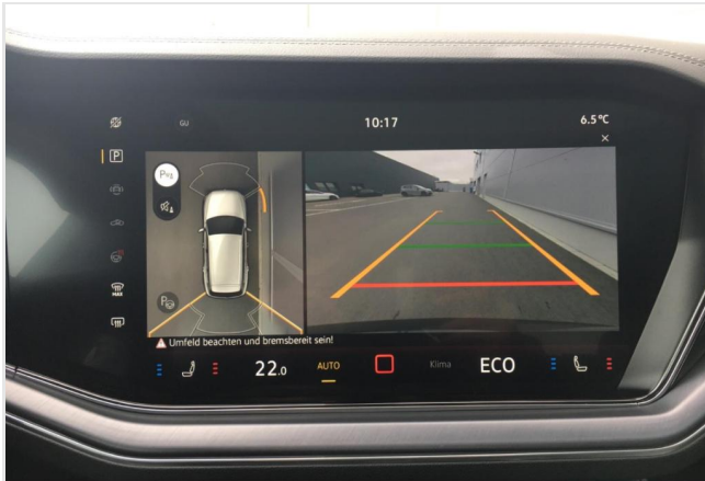
Neuss GOTTFRIED SCHULTZ

Angebotsnummer: 90605 Ausdruck vom: 27.04.2024