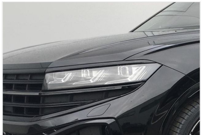
Neuss GOTTFRIED SCHULTZ