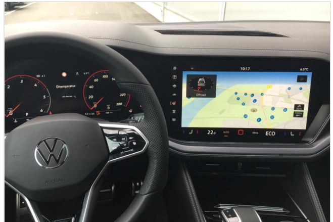
Neuss GOTTFRIED SCHULTZ