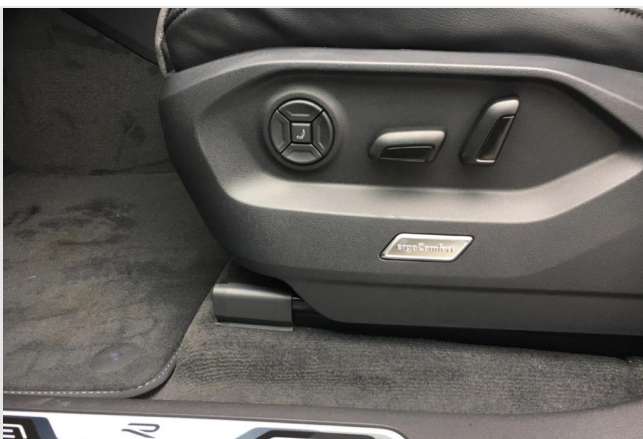
Neuss GOTTFRIED SCHULTZ