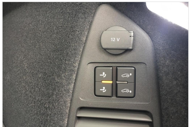
Neuss GOTTFRIED SCHULTZ