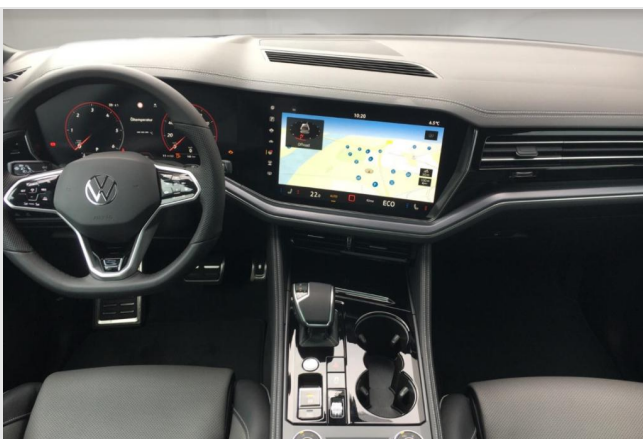
Neuss GOTTFRIED SCHULTZ