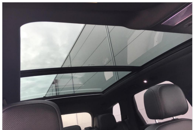
Neuss GOTTFRIED SCHULTZ