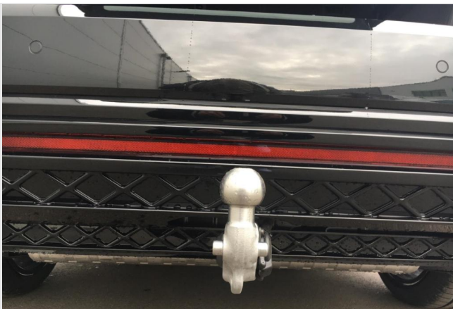
Neuss GOTTFRIED SCHULTZ