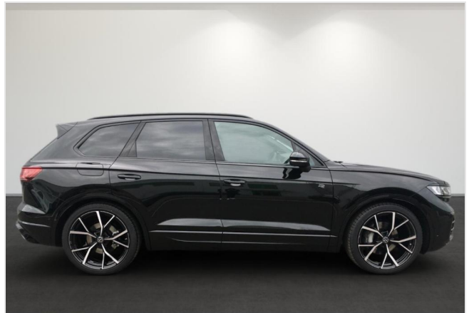
Neuss GOTTFRIED SCHULTZ