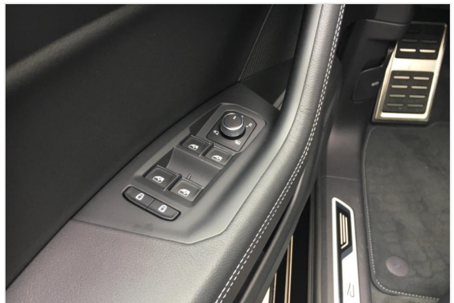
Neuss GOTTFRIED SCHULTZ