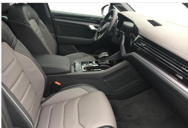
Neuss GOTTFRIED SCHULTZ